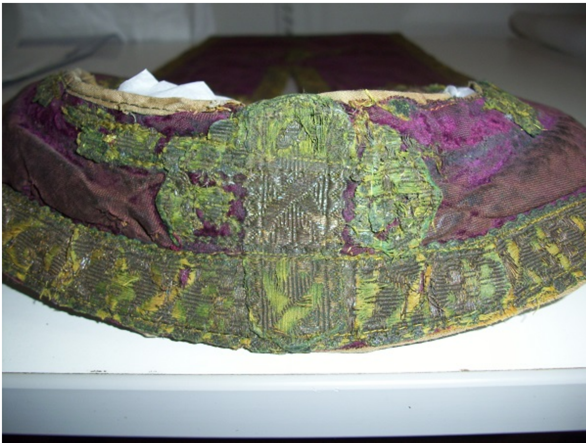
Εικ. 7 Λεπτομέρεια μετά την στερέωση και την επιπεδοποίηση του σημείου.

Τέλος, πραγματοποιήθηκαν στερεωτικές επεμβάσεις με μεταξωτό νήμα ακολουθώντας της βελονιές 'couching' και μικρή μεγάλη 'short & long' όπου ήταν δόκιμο και εφικτό στην στερέωση των μεταλλικών νημάτων και του υφασμάτινου κάμπου (Εικόνα 7).