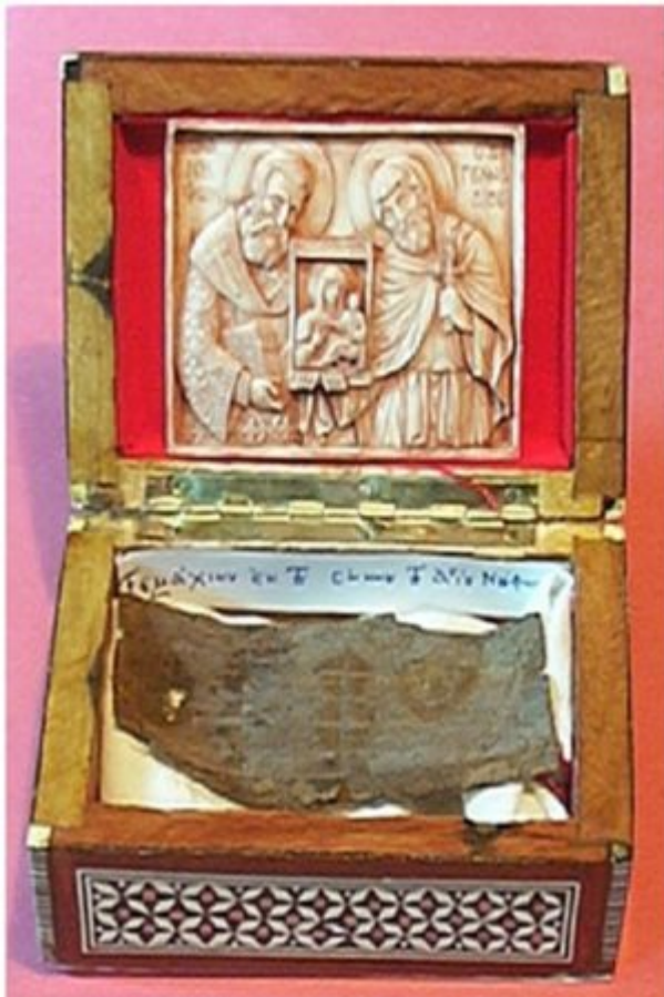
Εικ. 1. Τεμάχιο από το σάκκο του Αγ. Νήφωνος που εκτίθεται στο σκευοφυλάκιο της Ι. Μ. Αγ. Διονυσίου Αγίου Όρους.

Αναφορές για θαυματουργικές ιδιότητες ενδυμάτων από τα πρόσωπα που έφεραν την χάρη του Αγ. Πνεύματος, έχουμε ήδη από τους πρώτους αποστολικούς χρόνους στις Πράξεις των Αποστόλων (19:11-12). Τα σουδάρια και τα λινοειδή υφάσματα (σιμικίνθια) των αποστόλων πραγματοποιούσαν θαύματα και εξέβαλλαν δαιμόνια. Ο ευαγγελιστής Μάρκος αναφέρει ότι όταν η Βερονίκη ακούμπησε κρυφά το ιμάτιο του Χριστού θεραπεύτηκε (Μαρκ. 5:28-29).