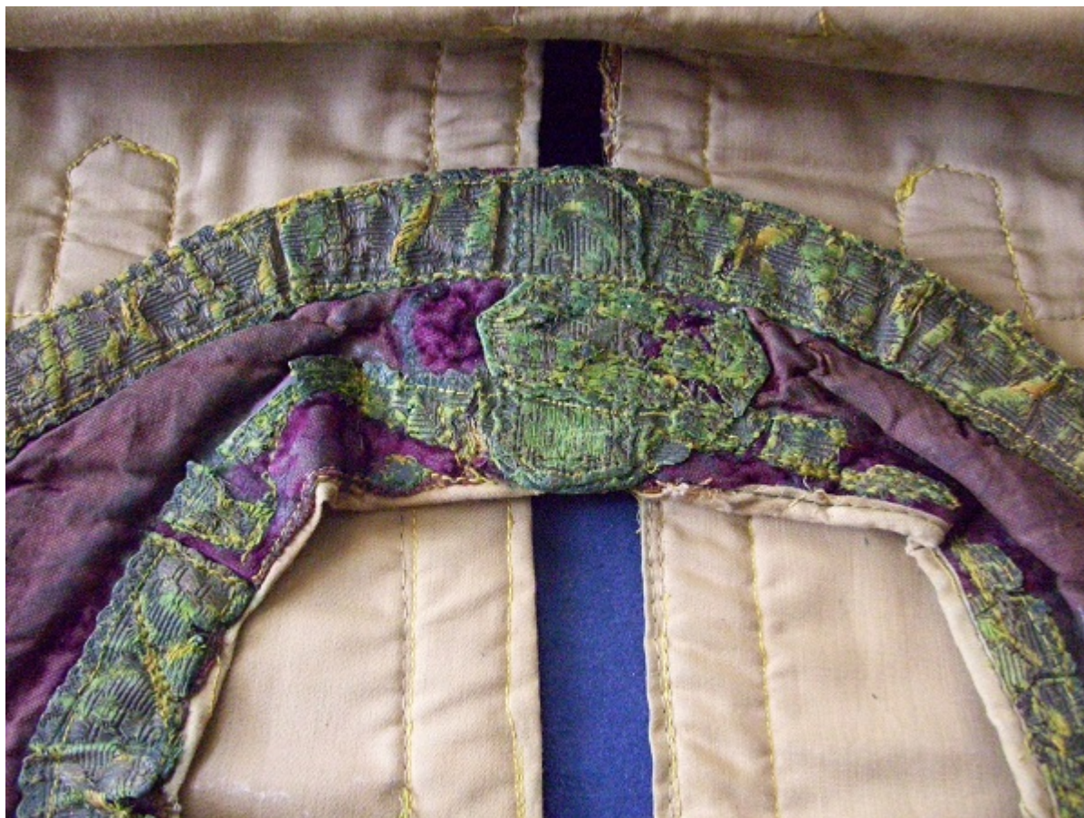
Εικ. 4 Λεπτομέρεια του σταυρού πριν την συντήρηση.