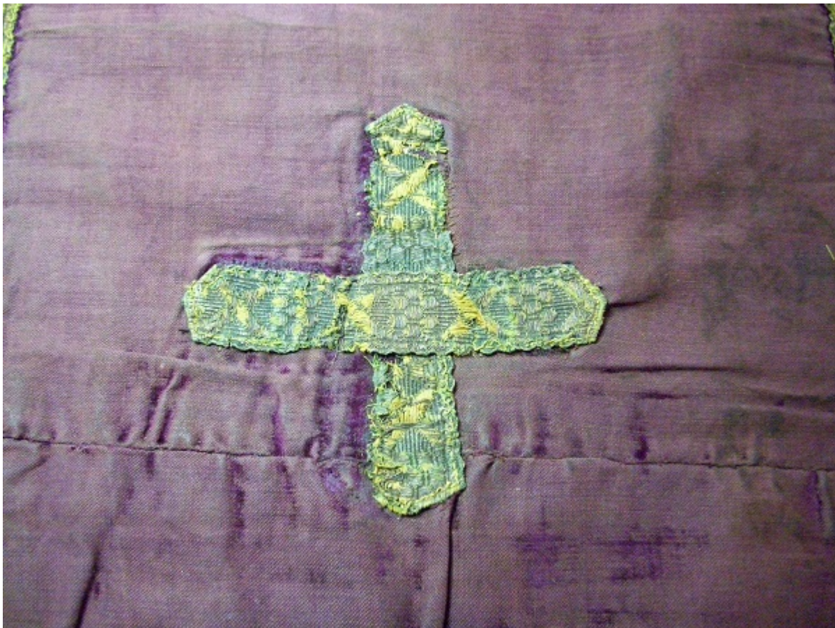
Εικ. 2 Λεπτομέρεια ένωσης υφασμάτων στον κάμπο.

Το επιτραχήλιο είναι κατασκευασμένο από τμήματα υφασμάτων επιρραμένα μεταξύ τους (Εικόνα 2). Δεν πρόκειται για ένδυμα με πλούσιο διάκοσμο και κεντημένες παραστάσεις, είναι ένα απλό λειτουργικό ένδυμα λαμβάνοντας υπόψη την βιογραφία του Αγ. Νικολάου όπου διακρίθηκε για την ταπεινότητα και την απλότητα του ως ιερέας. Η σύντομη διαδρομή του αντικειμένου όπου και εξιστορήθηκε από τον π. Νεκτάριο Μαμαλούγκο, είναι ότι ο ιερομόναχος Χρυσάνθος Αγιαννανίτης (1895-1981) [6] όπου βαπτίσθηκε από τον Αγ. Νικόλαο τον Πλανά όταν μόνασε στο Άγιο Όρος και ιερώθηκε έλαβε το επιτραχήλιο ως δώρο. Προς το τέλος του βίου του πρόσθεσε μεταλλικά κρόσσια στο κάτω σημείο του επιτραχηλίου όπου και το δώρισε στον ιερομόναχο Βαρλαάμ, ο οποίος με την σειρά του το παραχώρησε στον ανιψιό του, αγιογράφο Ελισαίο ο οποίος είναι και ο σημερινός κάτοχος του αντικειμένου.