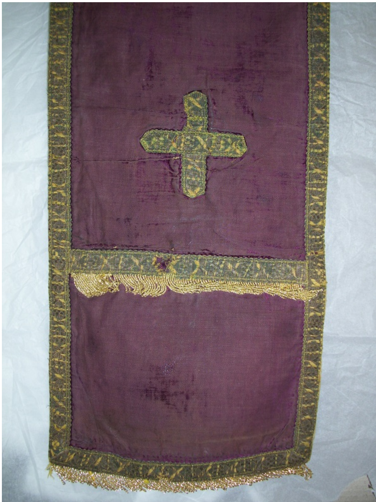
Εικ. 6 Τα νέα κρόσσια που είχαν τοποθετηθεί και δεν αφαιρέθηκαν κατά την διάρκεια της συντήρησης.

μεταλλικά νήματα δεν ήταν σε καλή σταθερή κατάσταση.