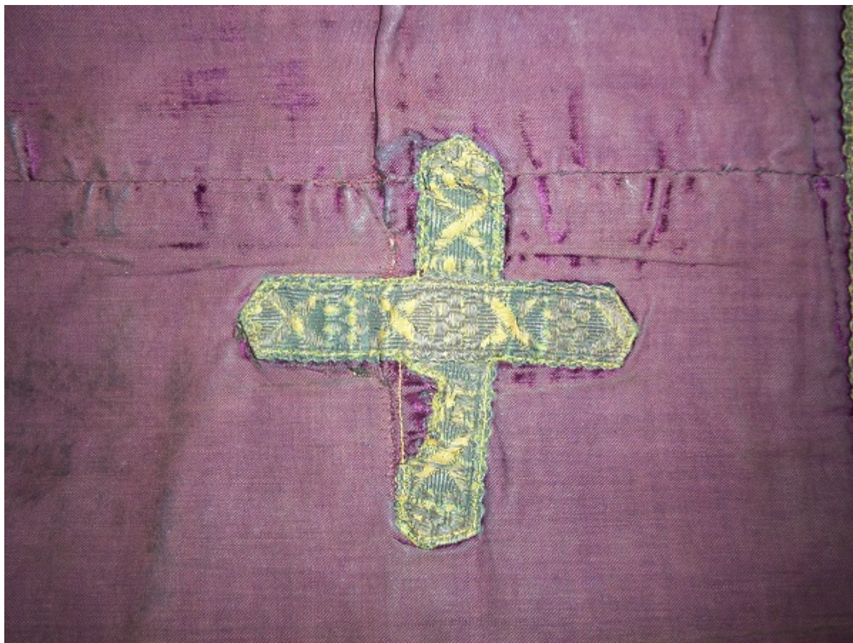
Εικ 3 Λεπτομέρεια σταυρού.

βελούδο όπου διακοσμείται με τρεις (3) μεγάλους σταυρούς, (Εικόνα 3) κατασκευασμένοι από μεταλλικά πεπλατυσμένα νήματα και με άλλους δύο (2), ίδιου τύπου στο σημείο του στήθους. Όμοια υλικά και διάκοσμο έχουν χρησιμοποιηθεί και για το περιμετρικό σειρήτι. Οι μέγιστες διαστάσεις του αντικειμένου είναι: 1.33 x 27,5εκ. Στο πίσω μέρος του τραχήλου το σημείο διακοσμείται με ένα μικρό σταυρό (Εικόνα 4). Περιμετρικά το επιτραχήλιο διακοσμείται με μεταλλικό σειρήτι. Το ένδυμα δεν φέρει διακοσμητική παρυφή και απολήγει σε μεταλλικά κρόσσια όπου είχαν τοποθετηθεί νεώτερα.