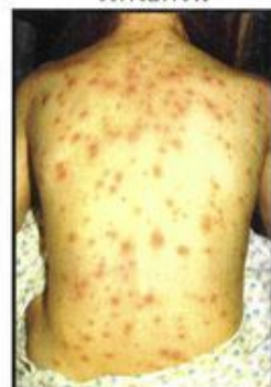
Chicken Pox Qoob Qhua Taum โรคอีสุกอีใส

Για να καταδειχθεί το ποιόν των αμφισβητήσεων αυτών, αξίζει να ριχτεί μια ματιά στη διαδρομή ενός διάσημου προπαγανδιστή τους, του Andreas Moritz (1954-2012). Όπως αναφέρεται στο επίσημο βιογραφικό του, ο ίδιος δεν σπούδασε Ιατρική, αλλά έγινε «διορατικός θεραπευτής», καθώς από παιδί ταλαιπωρούνταν από ασθένειες, οπότε μελέτησε διατροφολογία και φυσικές θεραπείες. Αργότερα εξάσκησε τις αγιουρβέδα (θεραπευτική τεχνική, που προέρχεται από αρχαίες ινδικές γνώσεις), ιριδολογία (διαγνωστική μέθοδος με βάση την ίριδα του ματιού), σιάτσου (θεραπευτική τεχνική με μασάζ, που προέρχεται από την κινέζικη και την ιαπωνική παράδοση) και θεραπευτική με δονήσεις .