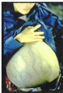
Hepatitis B Kaabmob Sab Dlaaj Hoon B โรคตับอักเสบบี