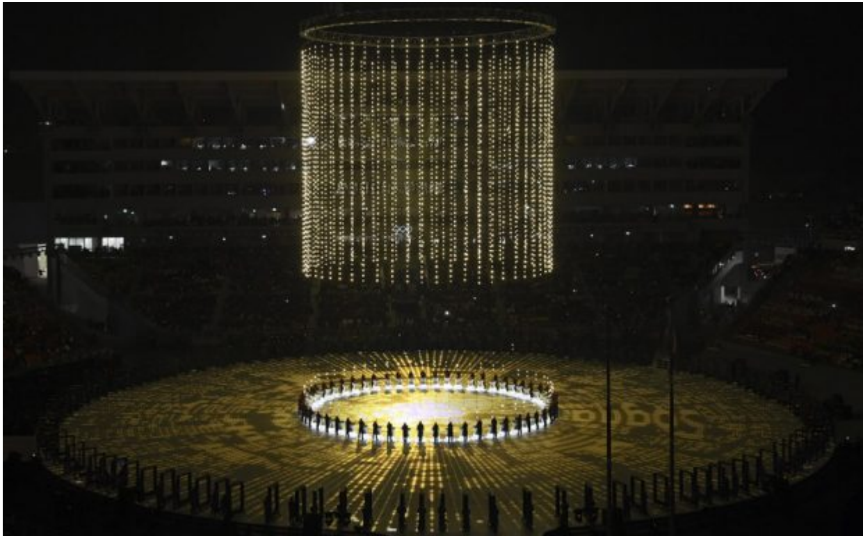
Performers participate during the opening ceremony of the 2018 Winter Olympics in Pyeongchang, South Korea, Friday, Feb. 9, 2018.