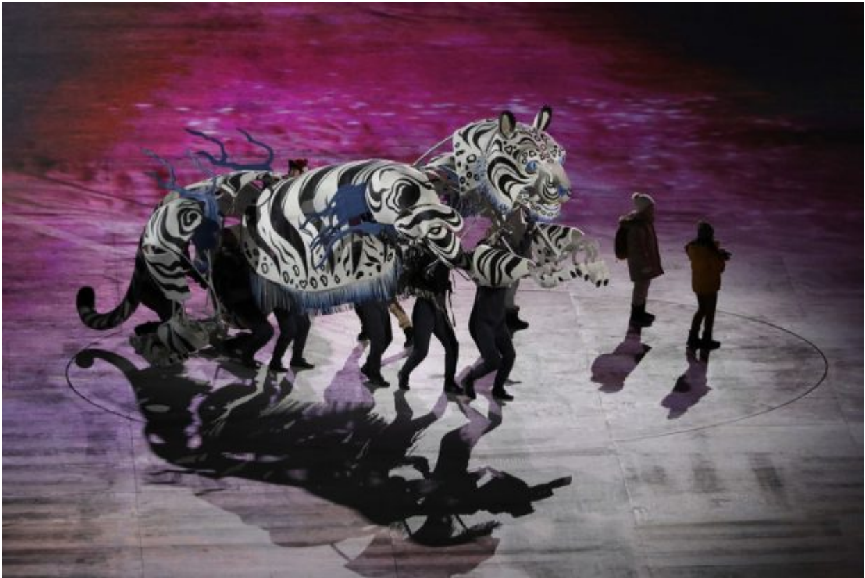
Dancers perform during the opening ceremony of the 2018 Winter Olympics in Pyeongchang, South Korea, Friday, Feb. 9, 2018.