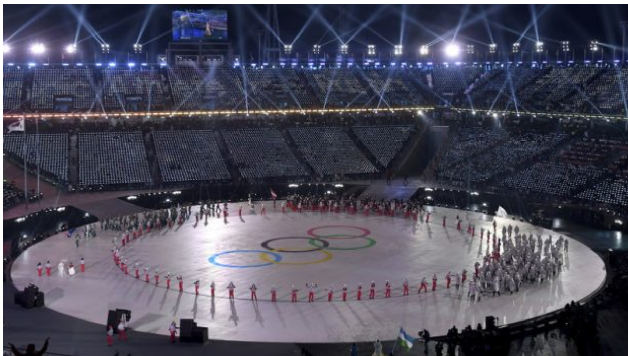
Athletes of Russia arrive during the opening ceremony of the 2018 Winter Olympics in Pyeongchang, South Korea, Friday, Feb. 9, 2018.

Πόσο κοστίζουν τελικά οι Χειμερινοί Ολυμπιακοί Αγώνες;