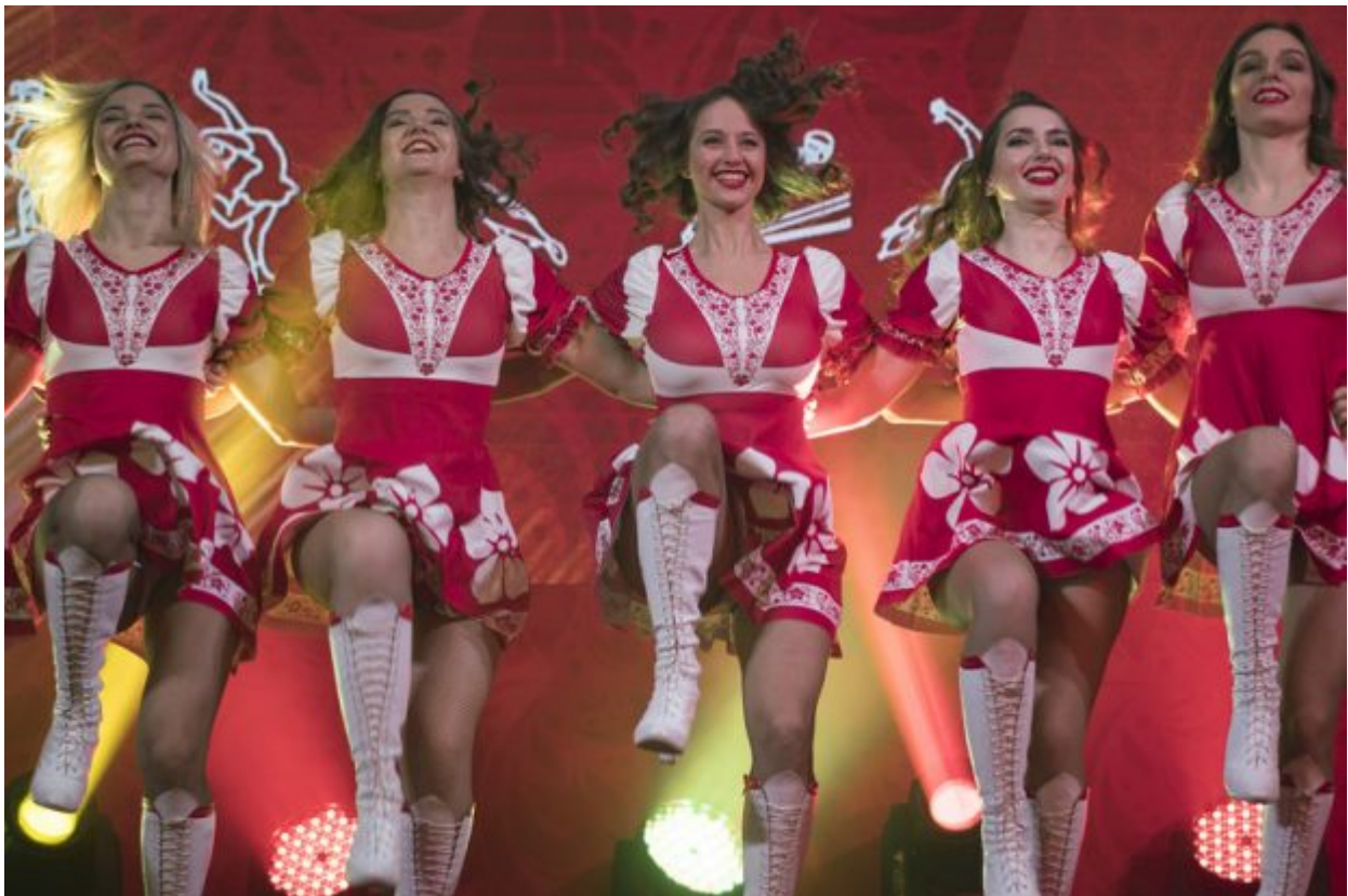
Russian cheerleaders perform during the opening of the Sports House, set up to support the Russian delegation of the 2018 Winter Olympics, in Gangneung, South Korea, Friday, Feb. 9, 2018.