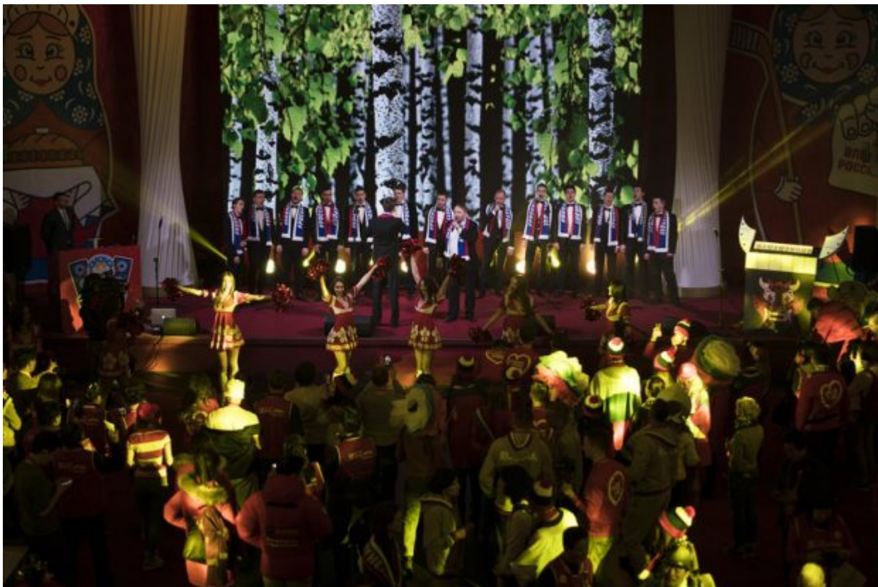
Russian singers and cheerleaders perform during the opening of the Sports House, set up to support the Russian delegation of the 2018 Winter Olympics, in Gangneung, South Korea, Friday, Feb. 9, 2018.