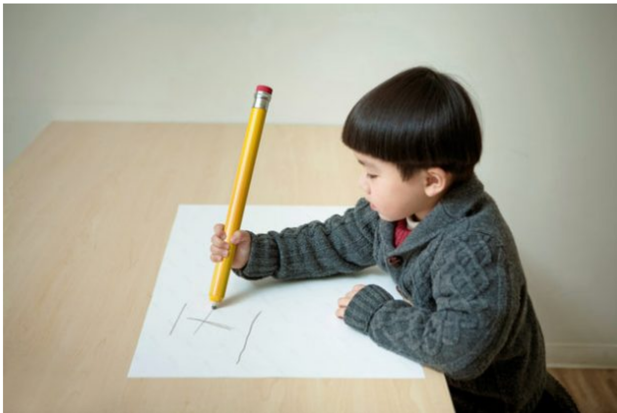
Boy writing on blank paper with huge pencil.

Είναι γεγονός ότι η εισαγωγή μίας νέας τεχνολογίας προκαλεί τεράστιες αλλαγές στην καθημερινότητά μας γιατί αυτός άλλωστε είναι και ο σκοπός της.