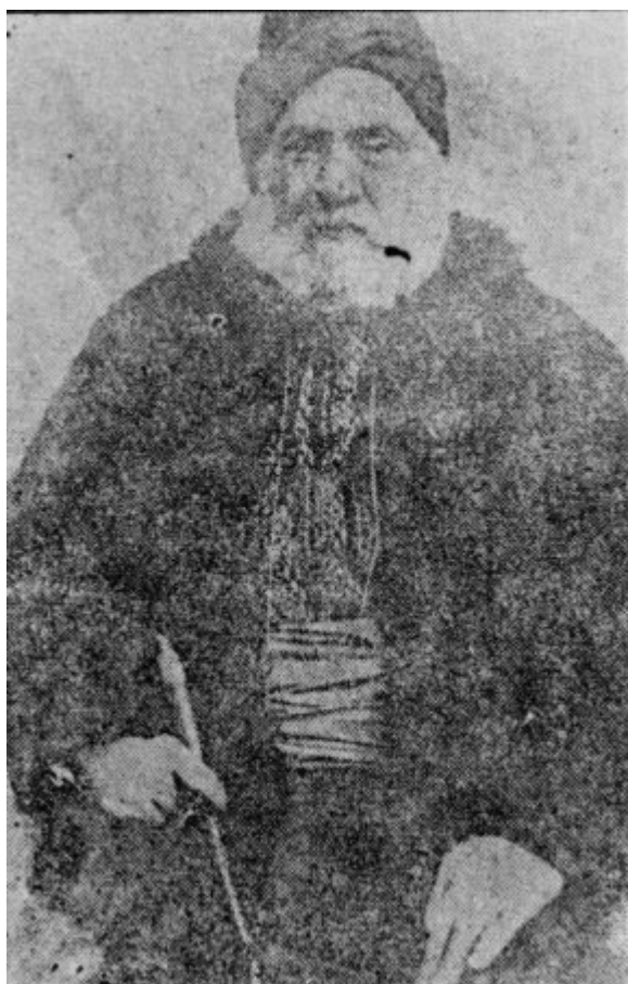
Κρυπτοχριστιανός της Κρώμνης του Πόντου.

???????????????????? ??????????, ??? ????? ????? ????????????? ????????? ???? ???? ????????????? ????????????????, ??' ????? ???? ????????? ???? ????????????????? ???? ?????????????????????, ????????? ????????? ???? ????? ??????????. ??? ????? ????? ???? ????????? ????????????????? ???? ????????? ?????????????????????????, ????????? ? ????????????? ???? ????????? ???? ? ?????????????????, ????????? ???? ????????? ? ????????????????? ????????????????? ?? ???? ????????????? ????????? ???? ?????????????????????, ????????? ????????????? ????????? ???? ????????? ???? ????? ?? ????????? ????????????? ???? ???? ????????? ????????????????????? ???? ????????????? ????????????????????? ????????????????????????????, ??? «????? ?????? ??????, ????????????? ?????????????????????».