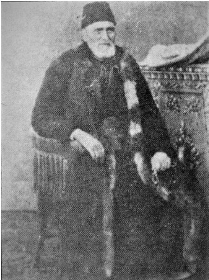
Χαρακτηριστική αμφίεση Κρυπτοχριστιανού (Κλωστού) του Πόντου που επισκέφτηκε τους Αγίους Τόπους (Χατζής).

?????? ???? ? ?????? ?????????????????? ??? ????? ????? ?????????? ?????????? ?? ??????????? ?????????????? ??????? ?? ? ?????????????????? ?????? ?????????????? ?????????????? ??? ?????????? ?? ????????, ??? ?? ?? ??? ??????? ??????????????????????.