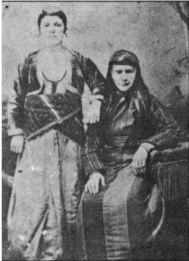
Γυναίκες Κρυπτοχριστιανών που ανήκουν σε δύο διαφορετικές γενιές.

– «?? ??????????? ??, ?????, ??????? ?????????, ????? ?? ??????????? ?? ??????????? ???. ?? ?? ?????????, ?????; ? ????? ?? ????????? ?? ????????? ?? ?????????». ??????? ??????????? ?? ???????? ?? ??????? ?? ?? ??????????? ?? ?? ???????, ?? ????????? ?? ????????? ?? ?? ??, ? ?????? ?? ??????? ??????????? ?? ???????, ?? ?? ??????? ??????????? ?? ?????????? ? ??????????? ?? ?????????? ???».