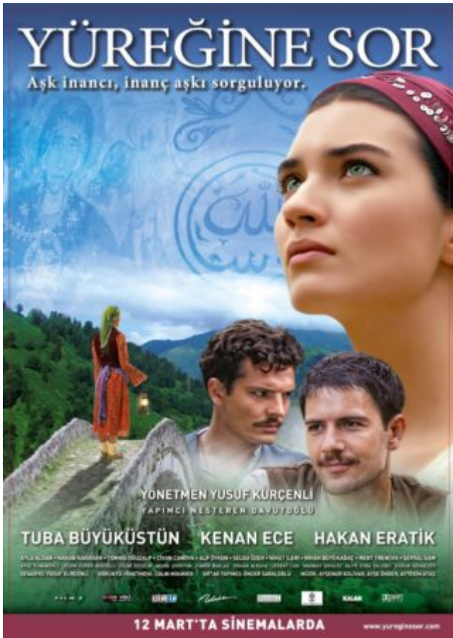
Αφίσα της τουρκικής ταινίας «Ρώτα την καρδιά σου» (Yuregine Sor) με θέμα τους Κρυπτοχριστιανούς του Πόντου.

??? ??? ??? ??? ?? ??? ?????????? ?????».