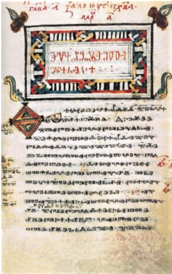
Κώδιξ του Ζωγράφου

μαθητών του αγ. Αθανασίου ύπαρξη Σλάβων μοναχών, όταν μάλιστα ληφθεί υπόψη ότι η αίγλη του μεγάλου Αθωνίτη μοναχού είχε ελκύσει κοντά του μαθητές από την μακρινή Ιβηρία και την Ιταλία.