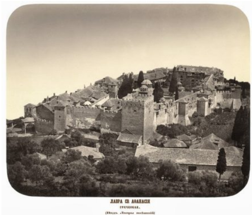
Λαύρα Αγίου Αθανασίου του Αθωνίτη.

Αρχικά αυτός κατευθύνθηκε στην Μονή του Σινά, όπου συμπληρώθηκε η κατήχησή του και έγινε δεκτός στο βάπτισμα, στην συνέχεια δε έφθασε στο Άγιον Όρος, όπου έλαβε το μοναχικό σχήμα και παρέμεινε τρία χρόνια. Αφού επέστρεψε στην πατρίδα του έγινε θερμός κήρυκας της ορθόδοξης πίστης, επειδή όμως συνάντησε την αντίδραση του πατέρα τον Μίντβογκ, εγκαταστάθηκε κάπου κοντά σε χριστιανούς και ίδρυσε μοναστήρι, μεταλαμπαδεύοντας έτσι εκεί τον ορθόδοξο μοναχισμό, όπως τον είχε γνωρίσει στο Σινά και στο Άγιον Όρος.