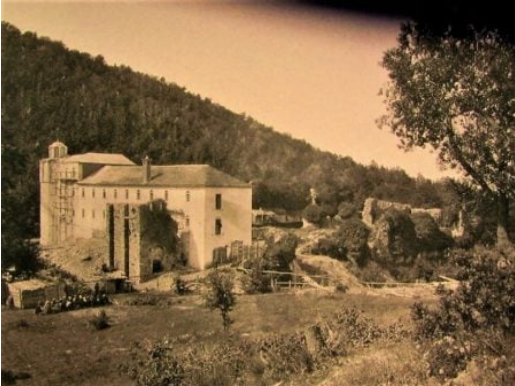
Παλαιομονάστηρο, Μονή Θεσσαλονικέως.

της ρωσικής μονής, παρέχεται η πληροφορία ότι αυτή είχε στην κατοχή της αντικείμενα και είδη, των οποίων ο όγκος και ο αριθμός εξηγούνται μόνο με την υπόθεση ότι στην μονή υπήρχε αρκετά μεγάλη μοναστική αδελφότητα.