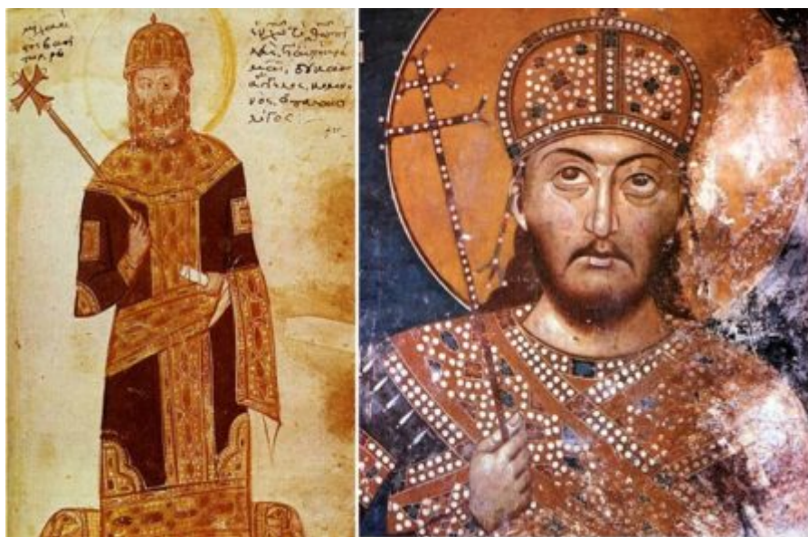
Ο Αυτοκράτορας Ανδρόνικος ο Β' και ο κρλής των Σέρβων Στέφανος Μιλούτιν.

Το Άγιον Όρος γνώρισε επίσης λεηλασίες και καταστροφές. Στις αρχές του 14ου αιώνα προέβησαν σε επιδρομή οι Καταλανοί, οι οποίοι άφησαν ανεξάλειπτες τις ζοφερές αναμνήσεις στην μνήμη των Αγιορειτών. Θύμα της επιδρομής αυτής το 1309 υπήρξε και η ρωσική Μονή του Αγίου Παντελεήμονος, την οποία, αφού με δόλια τρόπο πυρπόλησαν οι επιδρομείς, κάηκε αυτή ολοκληρωτικά. Διασώθηκε μόνο ο πύργος της, μέσα στον οποίο βρισκόταν αυτόπτης μάρτυρας των συμβάντων ο Σέρβος αρχιεπίσκοπος Δανιήλ μαζί με κάποιους μοναχούς.