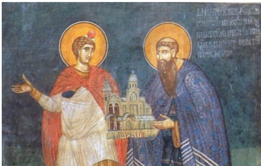
Δεξιά, ο αγιορείτης Σέρβος Αρχιεπίσκοπος Δανιήλ.

Το Άγιον Όρος γνώρισε επίσης λεηλασίες και καταστροφές. Στις αρχές του 14ου αιώνα προέβησαν σε επιδρομή οι Καταλανοί, οι οποίοι άφησαν ανεξάλειπτες τις ζοφερές αναμνήσεις στην μνήμη των Αγιορειτών. Θύμα της επιδρομής αυτής το 1309 υπήρξε και η ρωσική Μονή του Αγίου Παντελεήμονος, την οποία, αφού με δόλια τρόπο πυρπόλησαν οι επιδρομείς, κάηκε αυτή ολοκληρωτικά. Διασώθηκε μόνο ο πύργος της, μέσα στον οποίο βρισκόταν αυτόπτης μάρτυρας των συμβάντων ο Σέρβος αρχιεπίσκοπος Δανιήλ μαζί με κάποιους μοναχούς.