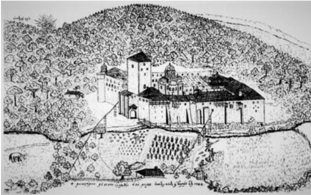
Παλαιομονάστηρο, σχέδιο Βασιλείου Μπάρσκυ 1744.

Σύντομα ο ηγούμενός της Παγκράτιος βρέθηκε στην ανάγκη να αναζητήσει άλλον τόπο στη Άγιον Όρος, όπου θα μπορούσε να μεταφερθεί με τους πολυπληθείς μοναχούς του. Έτσι, στις 15 Αυγούστου 1169 παρουσιάστηκε αυτός στην Σύναξη του Αγίου Όρους και ζήτησε μία από τις εγκαταλειμμένες και ερειπωμένες μονές για να μετοικήσει εκεί με την γύρω του αδελφότητα.