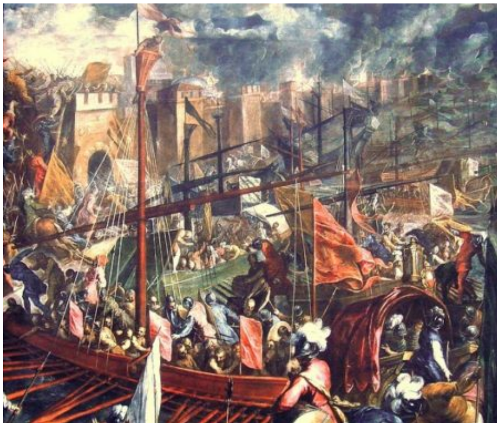
Άλωση της Κωνσταντινούπολης το 1204.

Η τέταρτη Σταυροφορία υπήρξε ισχυρότατα πλήγμα τόσο για το Βυζαντινό Κράτος, όσο και για ολόκληρη την Ορθόδοξη Εκκλησία. Εξάλλου η κατάληψη το 1240 του Κιέβου από τους Τατάρους, η οποία είχε ως συνέπεια την κατάλυση του ομώνυμου ισχυρού Ρωσικού Κράτους, παρέλυσε για μακρύ διάστημα την πολιτική και εκκλησιαστική ζωή της Ρωσίας.