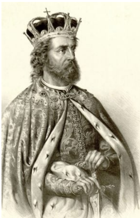
Ο κράλης των Σέρβων Στέφανος Ντουσάν.

Με την κατάληψη του Αγίου Όρους το 1345 από τον κράλη των Σέρβων Στέφανο Ντουσάν, η ρωσική μονή άρχισε να δέχεται πλούσιες τις χορηγίες του Σέρβου βασιλιά, ο οποίος αποδείχθηκε προστάτης και ευεργέτης των σλαβικών ιδιαιτέρως μονών. Στις κτήσεις της ρωσικής μονής πρόσθεσε αυτός νέα χωριά, την κήρυξε αυτόνομη βασιλική μονή και ανεξάρτητη από τον «πρώτα» του Αγίου Όρους και τοποθέτησε ηγούμενό της τον λογιότατο Σέρβο μοναχό Ησαία.