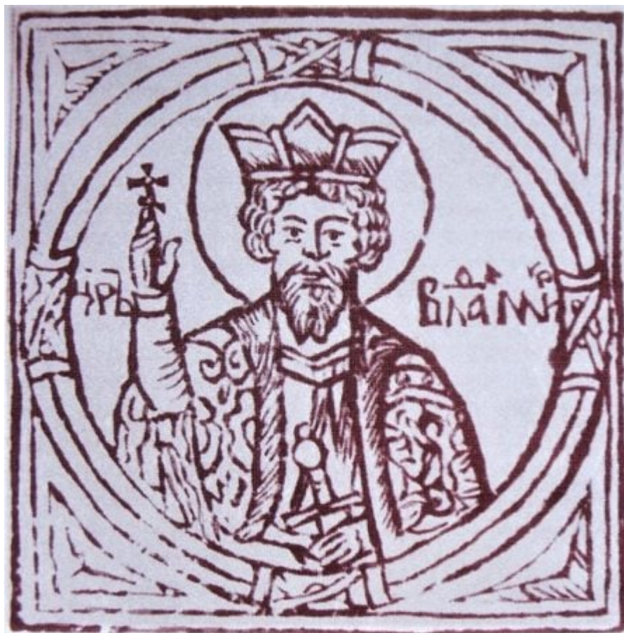
Ο ηγεμόνας Βλαδίμηρος.

Τα προβλήματα που δημιουργήθηκαν σχετικά με τις χρονολογίες από τις πληροφορίες του χρονικού επιχείρησε να τα λύσει ο συγγραφέας του μεταγενέστερου «Πατερικού της Σπηλαιωτικής Λαύρας του Κιέβου». Στο έργο αυτό γίνεται λόγος για δύο μεταβάσεις του Αντωνίου στο Άγιον Όρος, μια στην εποχή του ηγεμόνα Βλαδιμήρου και άλλη, αργότερα, επί ηγεμόνα Ιζιασλάβ (1054-1068 και 1068-1069).