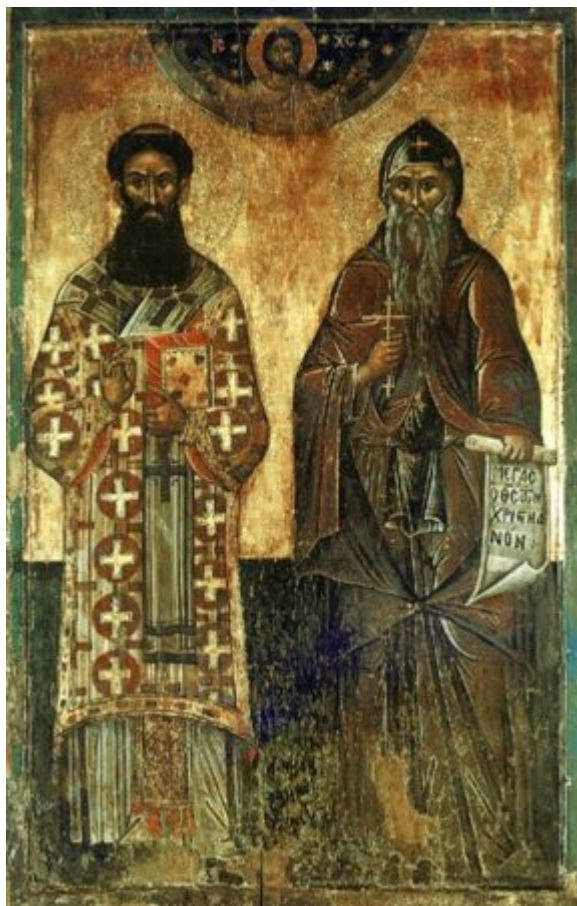
Οι Σέρβοι Άγιοι Σάββας και Συμεών.

Ο Σάββας ήρθε στο Άγιον Όρος γύρω στο έτος 1192 και αρχικώς κοινοβίασε στην ρωσική Μονή του Θεσσαλονικέως, η οποία τιμόταν ήδη στο όνομα του αγίου Παντελεήμονος, στην συνέχεια δε, μαζί με τον πατέρα του, ο οποίος επίσης ασπάστηκε τον μοναχικό βίο, ίδρυσε το 1198 την Μονή Χιλανδαρίου. Την εποχή εκείνη οι Ρώσοι κατείχαν στον Άθω την τρίτη θέση μεταξύ των εθνοτήτων που υπήρχαν εκεί, μετά τους Έλληνες και τους Ίβηρες.