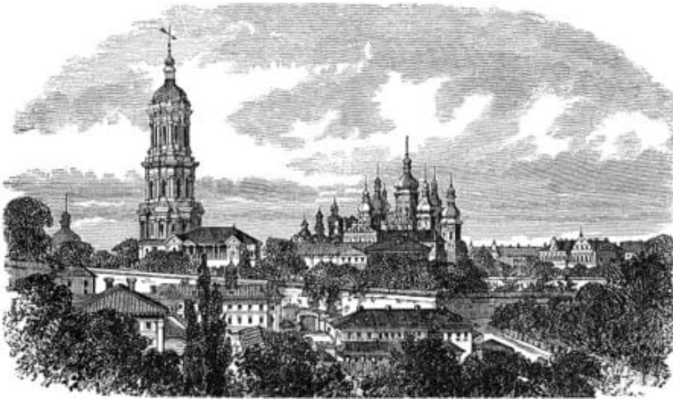
Λάυρα του Κιέβου.

Άξια προσοχής είναι η σημασία η οποία αποδιδόταν από τους Ρώσους στην «ευλογία του Αγίου Όρους», το οποίο την εποχή εκείνη ήταν οπωσδήποτε πολύ γνωστό στην Ρωσία. Όσο σαφείς και αν φαίνονται εκ πρώτης όψεως οι πληροφορίες του χρονικού για την μετάβαση του Αντωνίου στον Άθω, παρά τούτα όταν τεθούν υπό έλεγχο αποδεικνύονται συγκεχυμένες.