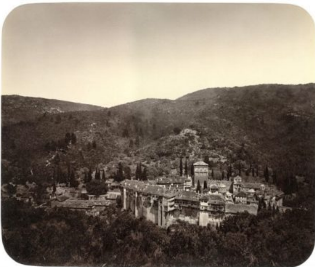
ХИЛАНДАРЪ Βλαδικονομική επισκοπή.

Περί τα μέσα του 13ου αιώνα το κύρος του Αγίου Όρους στην Ρωσία ήταν τέτοιο, ώστε σε ορισμένες επισκοπές να προκρίνονται ως υποψήφιοι επίσκοποι κληρικοί αγιορειτικής προελεύσεως. Χαρακτηριστική περίπτωση προτίμησης Αγιορειτών για επισκοπικό θρόνο είναι εκείνη της επισκοπής της πόλης Βλαδίμηρο. Οι ηγεμόνες της Γαλικίας Δανιήλ και Βασίλειος Ρομανόφ πέτυχαν να εκλεχθεί επίσκοπος για την επισκοπή Βλαδιμήρου ο Ρώσος Αγιορείτης Ιωάσαφ, όταν δε πέθανε αυτός, ο επίσης Αγιορείτης Βασίλειος.