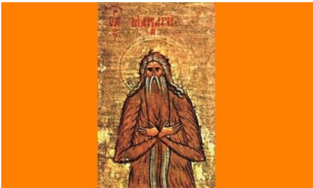
Όσιος Μακάριος ο Αλεξανδρινός.

Μας διηγόταν ο Παφνούτιος ο μαθητής του [Όσιου Μακαρίου του Αλεξανδρινού], ότι κάποια μέρα μια ύαινα πήρε το νεογνό της, που ήταν τυφλό, και το έφερε στο Μακάριο· και αφού χτύπησε την πόρτα της αυλής με το κεφάλι, μπήκε ενώ αυτός καθόταν έξω και έριξε στα πόδια του το νεογνό.