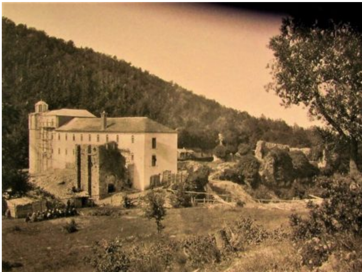
Παλαιομονάστηρο, Μονή Θεσσαλονικέως.

Ιδιαίτερη σημασία έχει η καταγραφή των ρωσικών βιβλίων που υπήρχαν εκεί, τα οποία ήταν: Ευαγγέλια, Ειρμολόγια, Συναξάρια, Παροιμίες, Μηναία, Παρακλητική, Οκτώηχοι, Πατερικό, Ψαλτήρια, έργα οσίου Εφραίμ του Σύρου, ο Βίος του αγίου Παγκρατίου, Ωρολόγια και Νομοκάνων, συνολικώς 52 βιβλία.