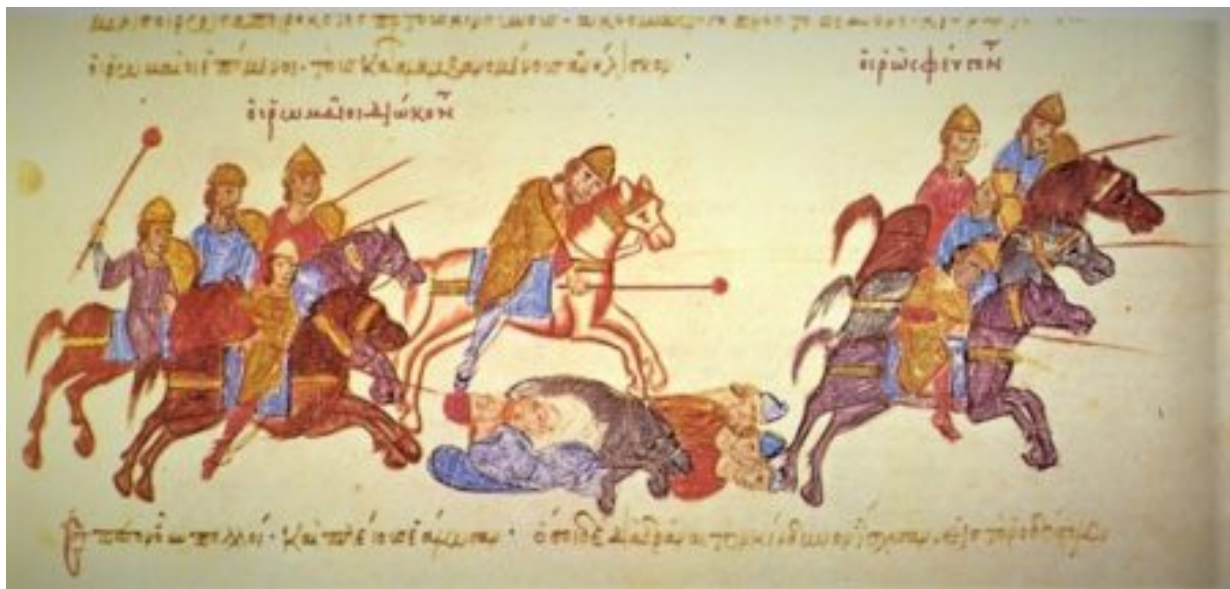
Σκηνή από τον Ρωσοβυζαντινό πόλεμο από εικονογράφιση χειρογράφου.

Η εμφάνιση ρωσικού στόλου στα βυζαντινά ύδατα επέτρεπε ίσως στους Αγιορείτες να σκεφθούν ότι οι Ρώσοι επιδρομείς θα μπορούσαν να δημιουργήσουν προπύργιο στην ρωσική μονή του Αγίου Όρους, η οποία, όπως άλλωστε όλες οι μονές της εποχής, ήταν κτισμένη σε σχήμα φρουρίου, είχε δε και πύργους.