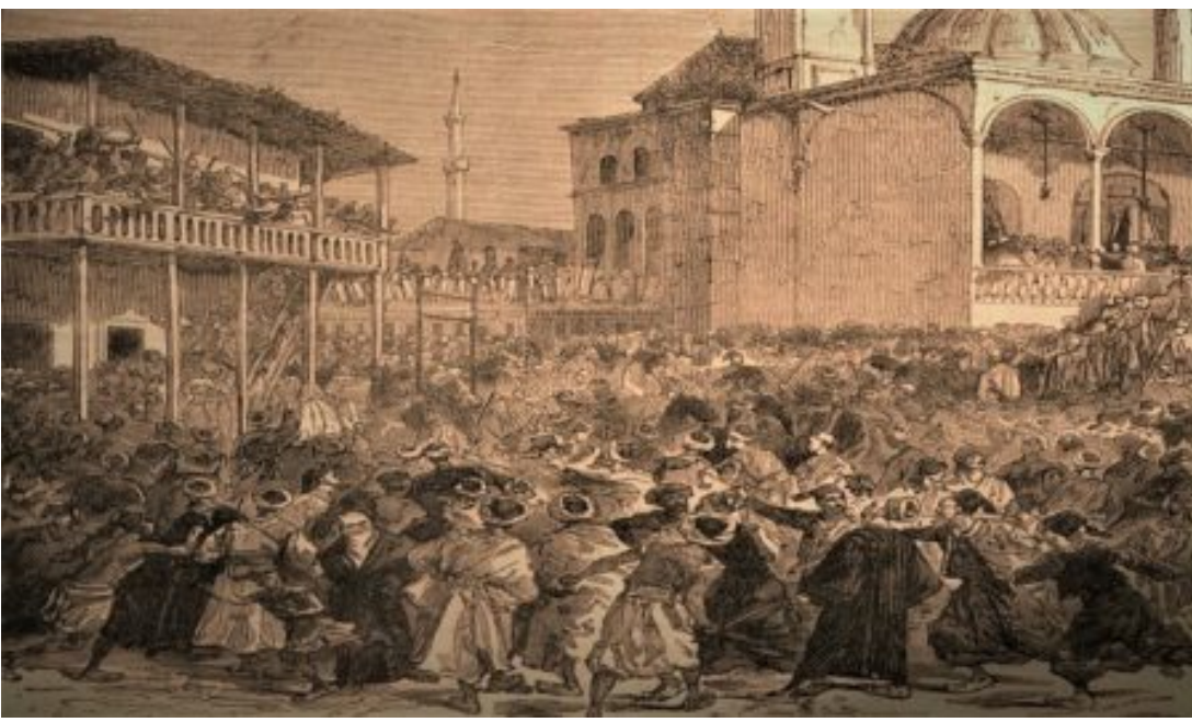
Η υπόθεση αυτή

έλαβε ανεξέλεγκτες διαστάσεις κατά την άφιξη της Στεφάνας με το τρένο στη Θεσσαλονίκη και την «απαγωγή» της από Έλληνες, οι οποίοι την οδήγησαν στο προξενείο των Ηνωμένων Πολιτειών Αμερικής. Οι μουσουλμάνοι της πόλης θεώρησαν το γεγονός αυτό casus belli , δηλαδή αιτία πολέμου, και τότε άρχισε η αντίστοιχη προετοιμασία για την «επανακατάληψη» της Στεφάνας. Έτσι, μετά την αρχική ενημέρωση στα «καφενεία και τα μπαρμπέρικα» των ομοθρήσκων τους, στη συνέχεια προχώρησαν σε στασιαστικό κάλεσμα και μάλιστα ένοπλο. Προφανώς ο στασιασμός αυτός είχε αποδέκτη ή στόχο τις ίδιες τις οθωμανικές αρχές, που είχαν την εξουσία. Και βέβαια η οχλοκρατική αυτή κινητοποίηση δεν άργησε να προκαλέσει τον τρόμο και τον πανικό στις άλλες δύο μεγάλες κοινότητες της πόλης, τους Εβραίους και τους Έλληνες, οι οποίοι έσπευσαν να κλειδαμπαρωθούν στα σπίτια τους για να μη δίνουν στόχο. Προφανώς ήξεραν από αντίστοιχες καταστάσεις.