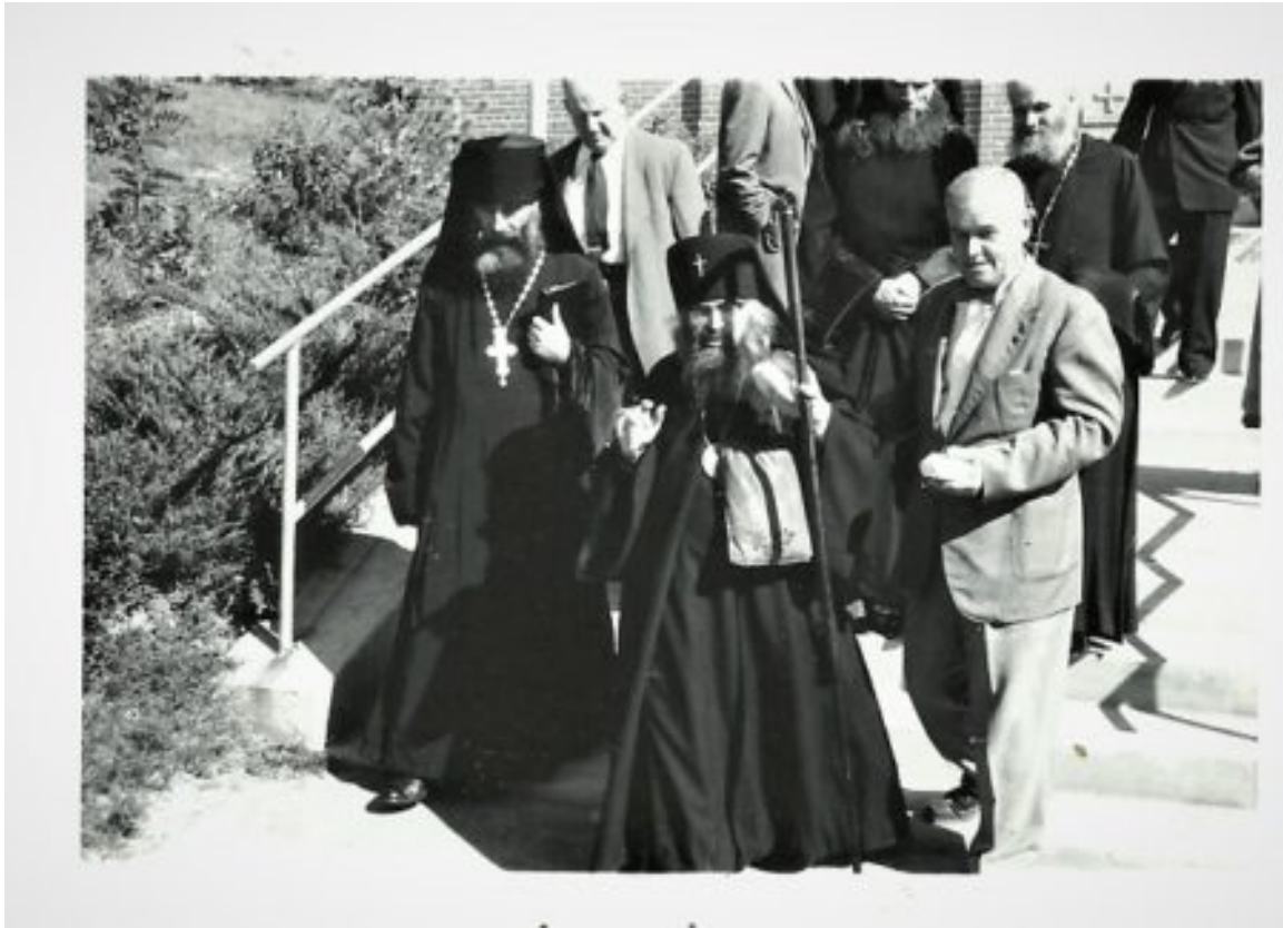
Ξεπροβοδίζοντας τον Επίσκοπο Άγιο Ιωάννη Μαξίμοβιτς από την ενορία του Αγίου Ιωάννου Βαπτιστού Ουασιγκτώνος.

«θα έρχομαι π. Νικόλαε αλλά να μη μου μιλάς γιατί φοβάμαι»!