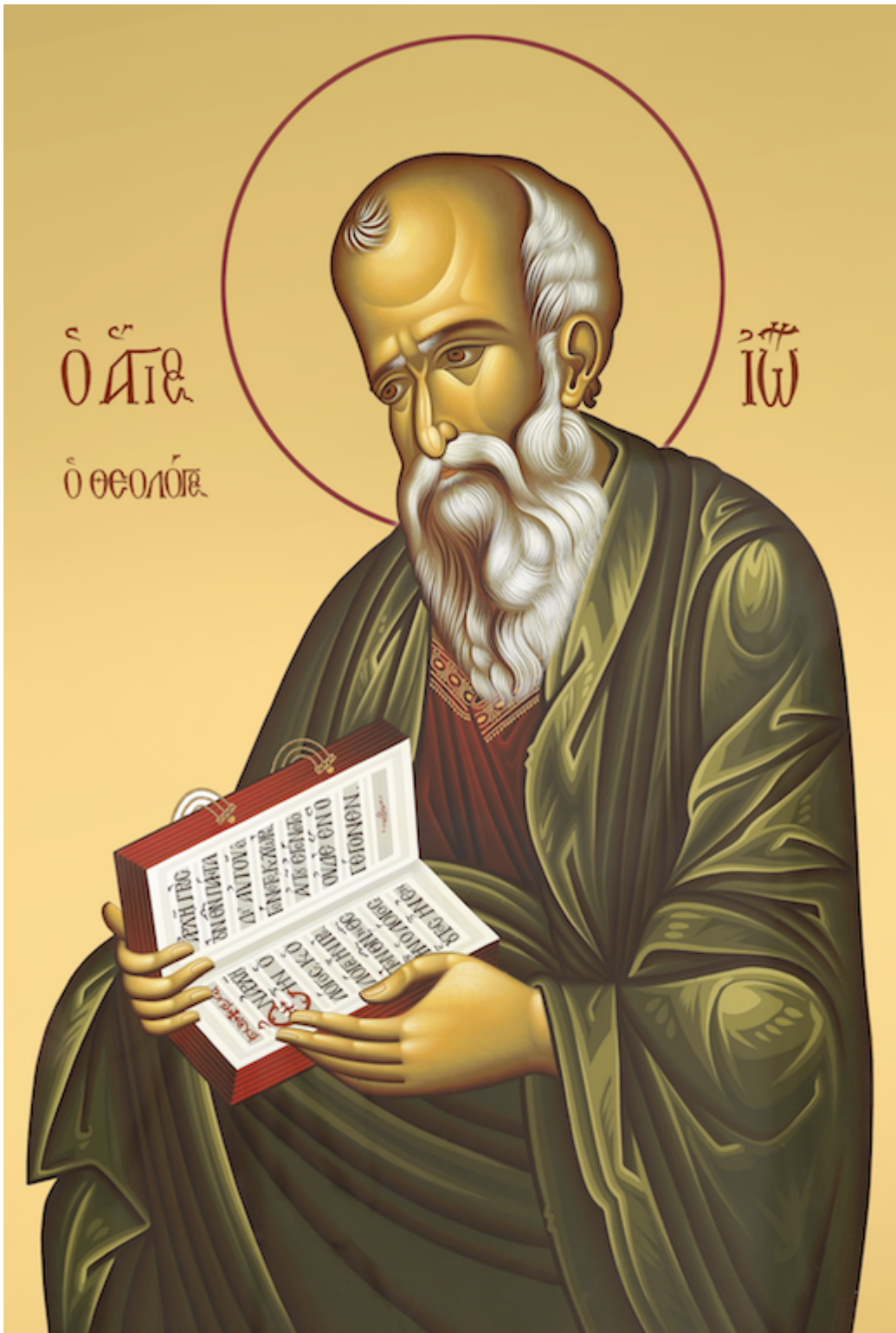
Άγιος Ιωάννης ο Θεολόγος

Η επιγραφή στον τάφο του Αγίου Παΐσιου του Αγιορείτου