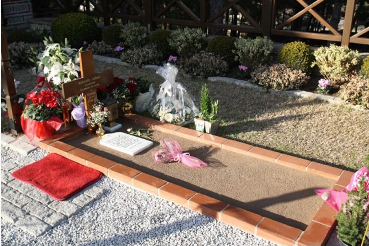
Ο Τάφος του Αγίου Παΐσιου του Αγιορείτου

L'entrée du monastère est interdite aux femmes en pantalon, en mini-jupe, en manches courtes ou ayant les épaules découvertes.