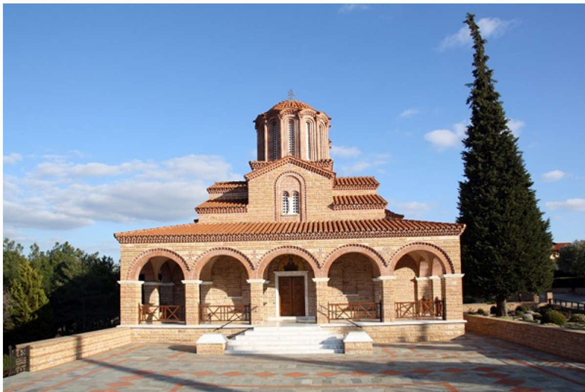
Ι.Ν.Αγίου Αρσενίου του Καππαδόκου