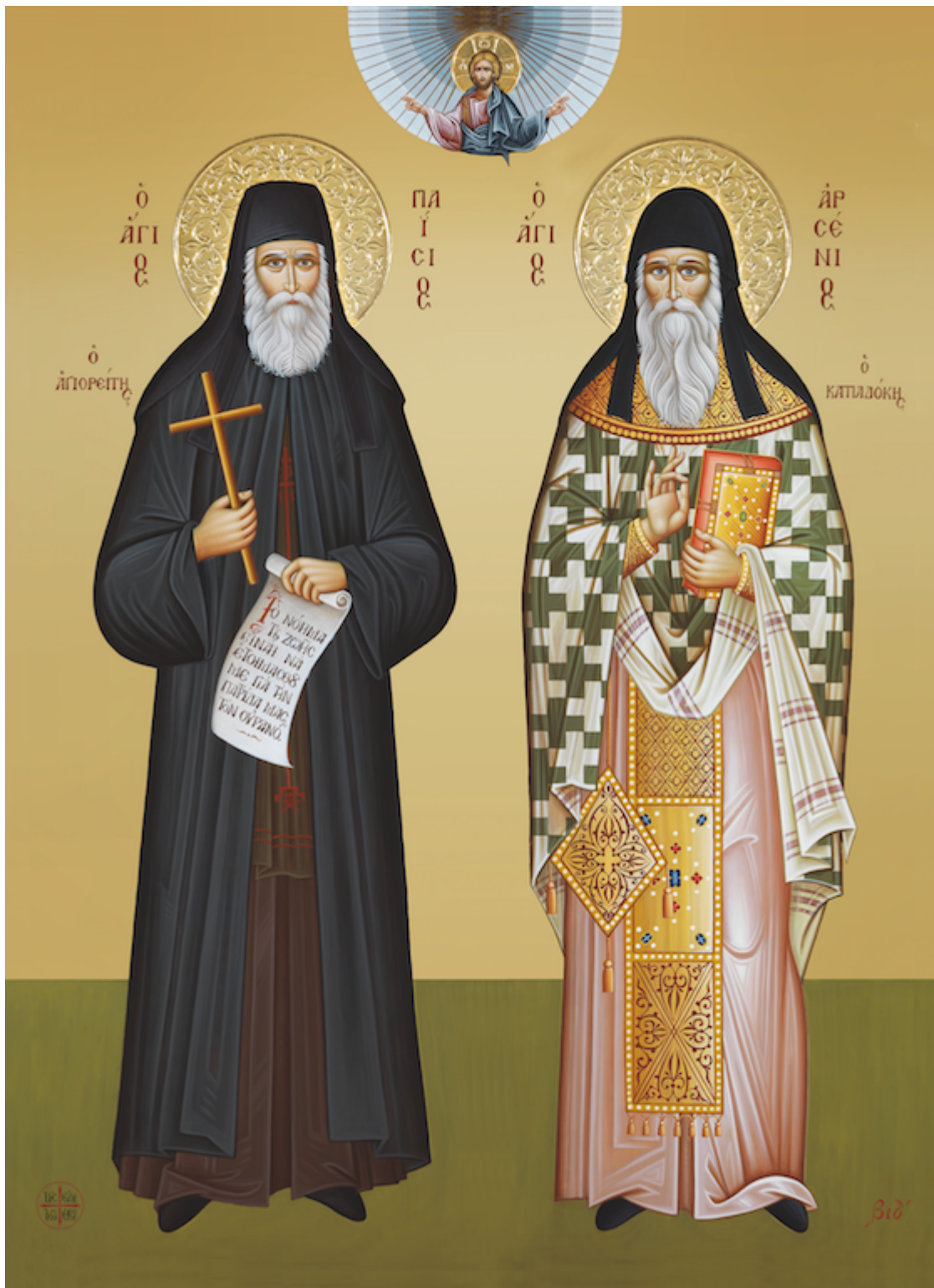
Άγιος Παΐσιος ο Αγιορείτης & Άγιος Αρσένιος ο Καππαδόκης