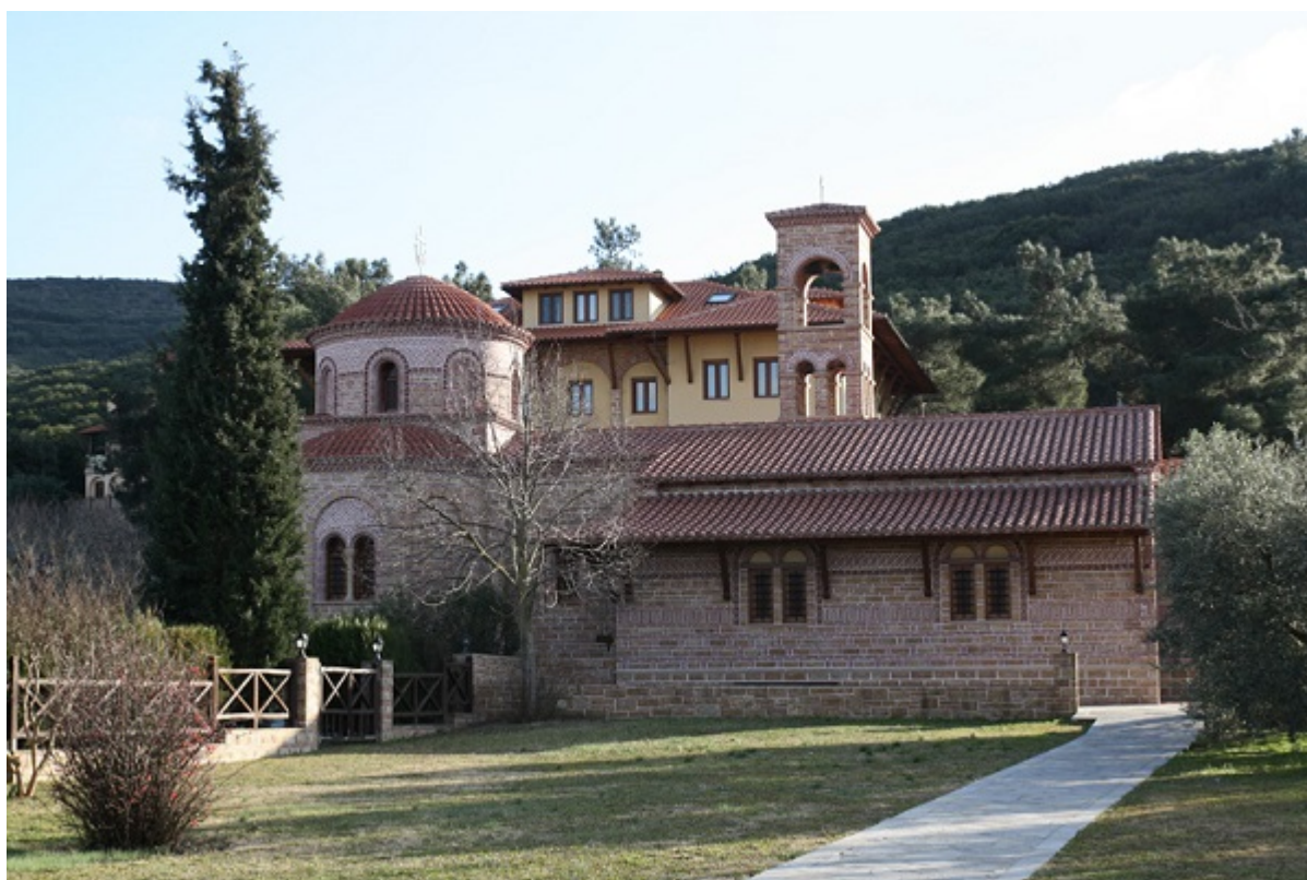
I.N.Αγίου Ιωάννου του Θεολόγου

Могила Святого Пайсия Святогорца находится в монастыре Святого Иоанна Богослова в Суроти рядом с Салониками. Для информации звонить на номер +30 23960 41320.