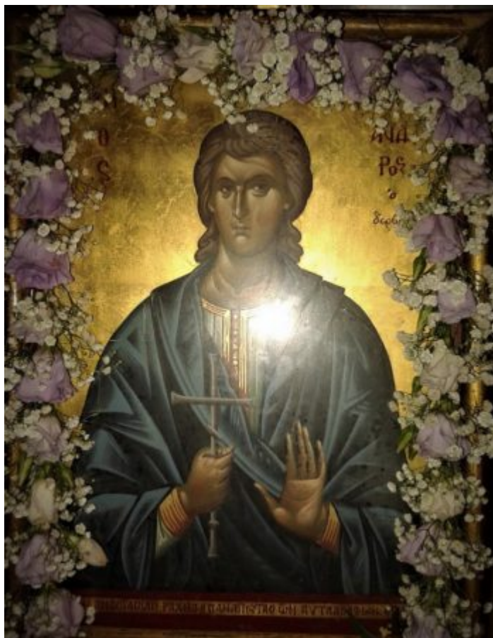
Εικόνα από την Εκκλησία Παναγία Λαοδηγήτρια της Θεσσαλονίκης, η οποία τιμά ιδιαίτερα την μνήμη του Αγίου Αλεξάνδρου του Δερβίση, ο οποίος ήταν ενορίτης της.

Ο Αλέξανδρος, κάποια στιγμή επέστρεψε στη Θεσσαλονίκη, αλλά δεν πήγε στο σπίτι του, δεν συναντήθηκε με τους γονείς του και έμεινε στην πόλη άγνωστος εν μέσω συγγενών, φίλων και γνωστών. Ήθελε φαίνεται, να δει για τελευταία φορά την γενέθλια πόλη και να χαιρετήσει, από λίγο μακριά και λίγο πιο κοντά -αλλά όχι εξ επαφής- τους γονείς, τους συγγενείς, τους φίλους, τους γνωστούς, την παιδική και νεανική του ηλικία. Αλλά και να κλάψει ίσως, τη ζωή που δικαιούταν να ζήσει, αλλά δεν μπόρεσε αφού γεννήθηκε Ρωμιός, δηλαδή ραγιάς για εκείνους τους χρόνους.