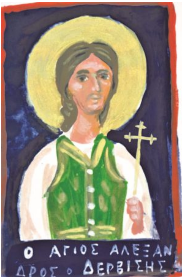
Έργο του Χρήστου Γουσίδη.

Πόσο όμορφα αναδύεται η μαρτυρική μορφή του ωραίου Θεσσαλονικιού Νεομάρτυρα Αλέξανδρου του Δερβίση μέσα από το συναξάρι του;