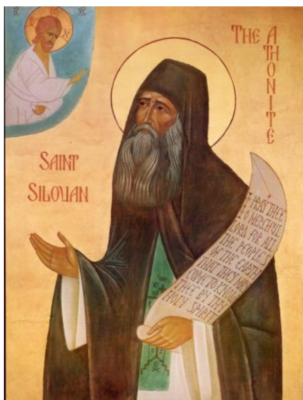
Ο Άγιος Σιλουανός ο Αθωνίτης.

Οφειλόταν, σε ό,τι άφορα τους Σλαύους, στις συνέπειες της εγκαταστάσεως του σοβιετικού καθεστώτος στη Ρωσία και, σε ό,τι άφορα τους Έλληνες, στην αναγκαστική έξοδο του 1922, που κατέστρεψε τον ακμαίο ελληνικό Χριστιανισμό της Μικράς Ασίας, και αργότερα στο Β' παγκόσμιο πόλεμο και τον εμφύλιο πόλεμο.