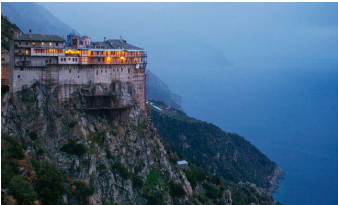
Ιερά Μονή Σίμωνος Πέτρα, Άγιον Όρος.

Η πρώτη παραμονή μας στον Άθωνα πραγματοποιήθηκε την άνοιξη του 1971. Στη Δύση τότε μιλούσαν για παρακμή και κατάρπωση του Αγίου Όρους και πολλοί δεν παρέλειπαν να προλέγουν την πλήρη εξαφάνιση του αθωνικού μοναχισμού στο πολύ προσεχές μέλλον.