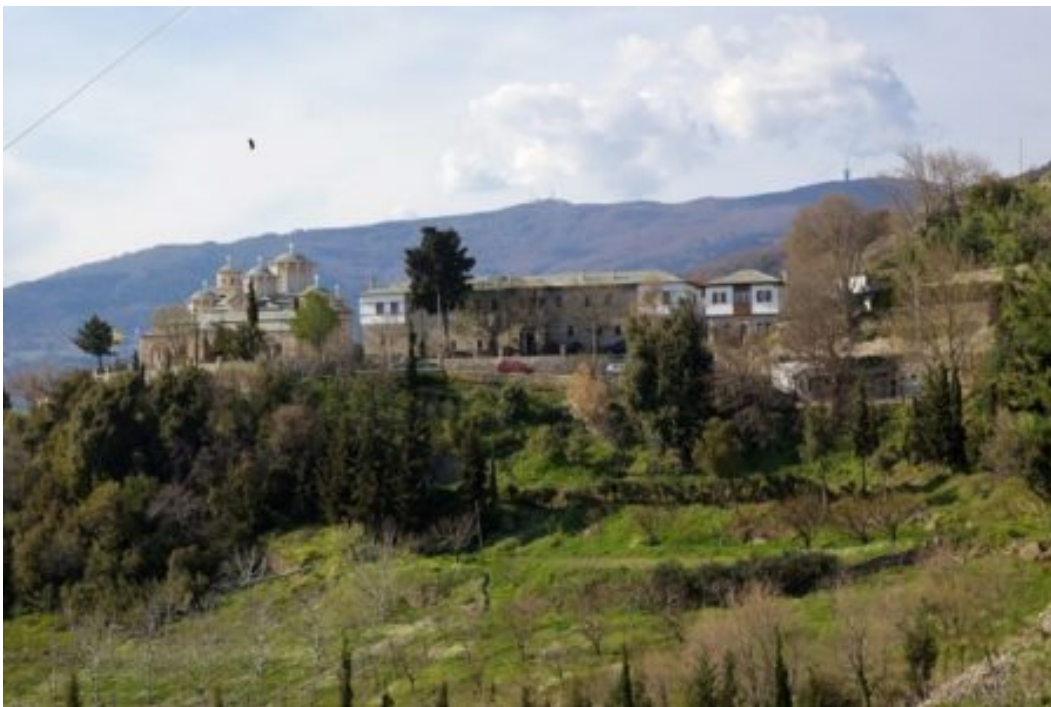
Ιερά Μονή Παμμεγίστων Ταξιαρχών Πηλίου.

Από το 1987 και μετά, με την ευλογία του Μητροπολίτου Δημητριάδος καί κατόπιν αρχιεπισκόπου Αθηνών και πάσης Ελλάδος κυρού Χριστοδούλου Παρασκευαΐδη, αφοσιώθηκε στην επανίδρυση και ανακαίνιση της ερειπωμένης τότε Ι. Μονής Παμμεγίστων Ταξιαρχών Πηλίου, και στη συγκρότηση της αδελφότητος αυτής, πυρήνας της οποίας υπήρξε μικρός αριθμός πνευματικών του θυγατέρων, που επιθυμούσαν τη μοναχική αφιέρωση.