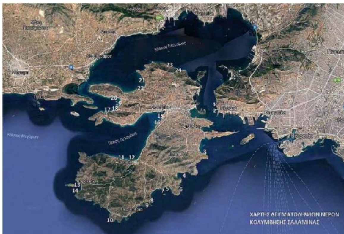
Πίνακας Αποτελεσμάτων μικροβιολογικών αναλύσεων σε δείγματα νερών κολύμβησης σε παραλίες της Σαλαμίνας