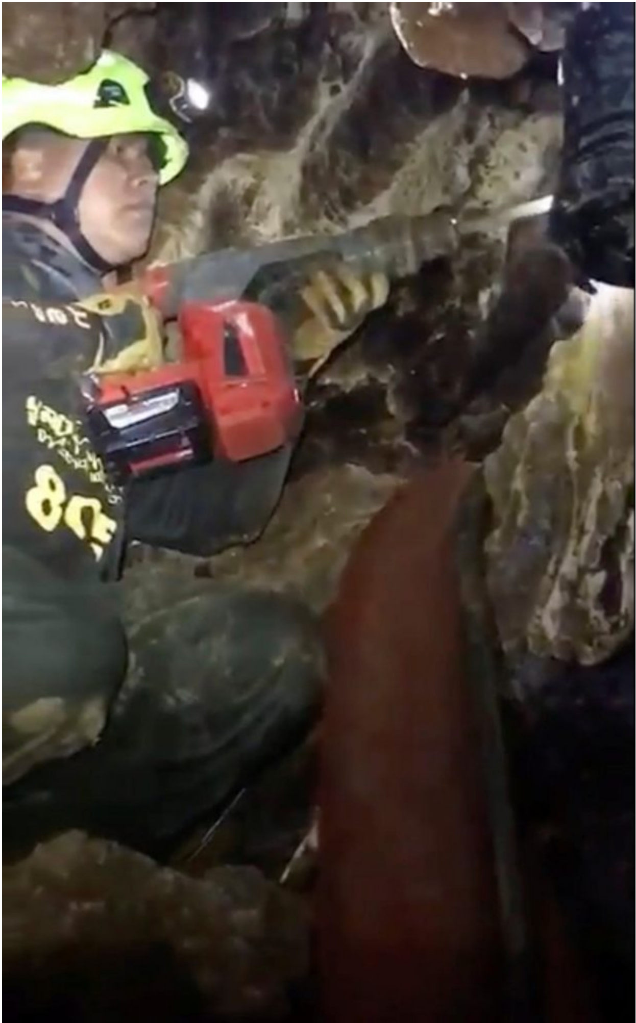
Ruamkatanyu Foundation rescuers are seen drilling ahead of the operation at the Tham Luang cave