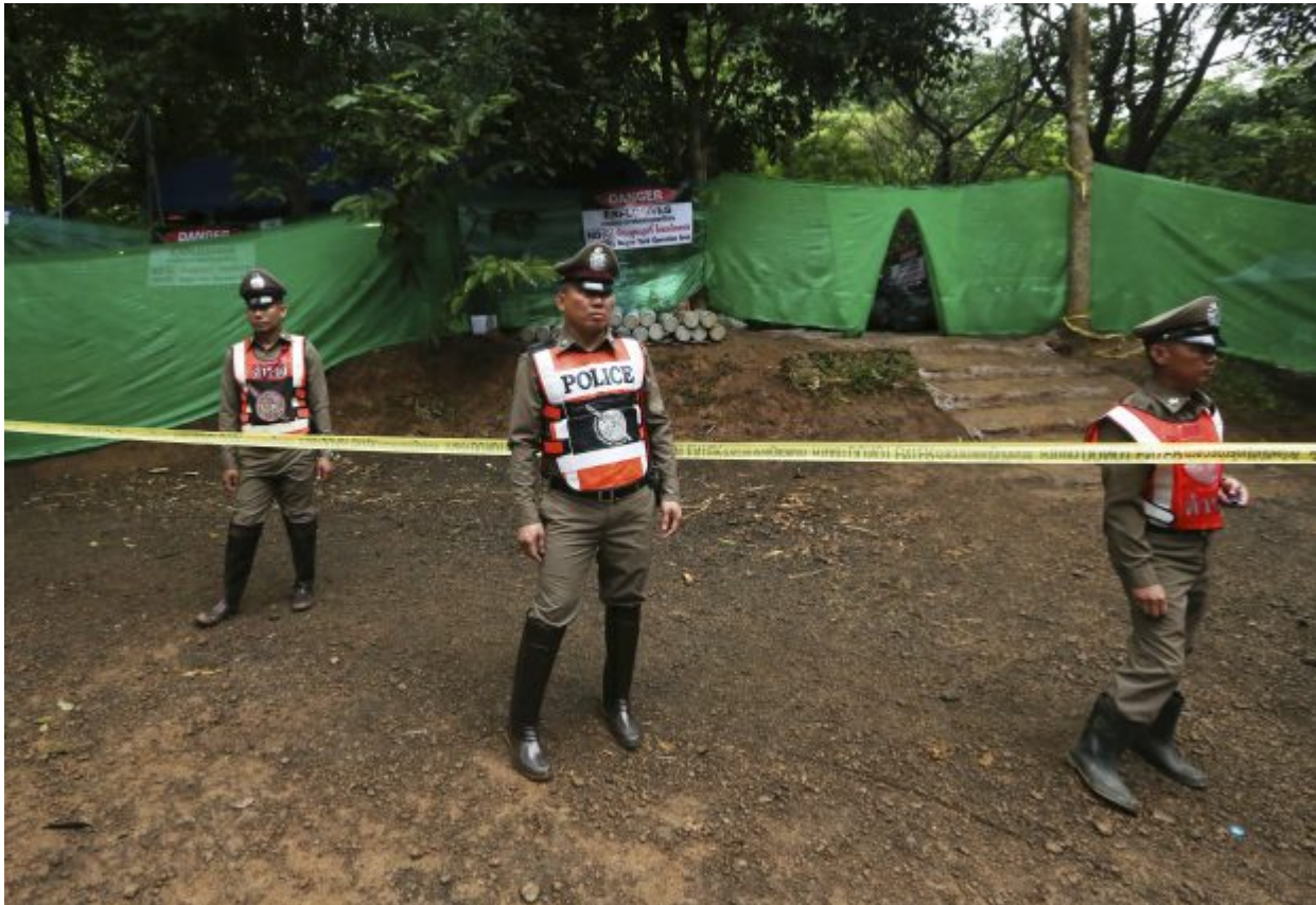
Thai policemen stand guard near a cave where 12 boys and their soccer coach have been trapped since June 23, in Mae Sai, Chiang Rai province, in northern Thailand Sunday, July 8, 2018. Thai authorities are racing to pump out water from the flooded cave before more rains are forecast to hit the northern region.

trapped inside a flooded cave, in the northern province of Chiang Rai, Thailand, July 8, 2018.