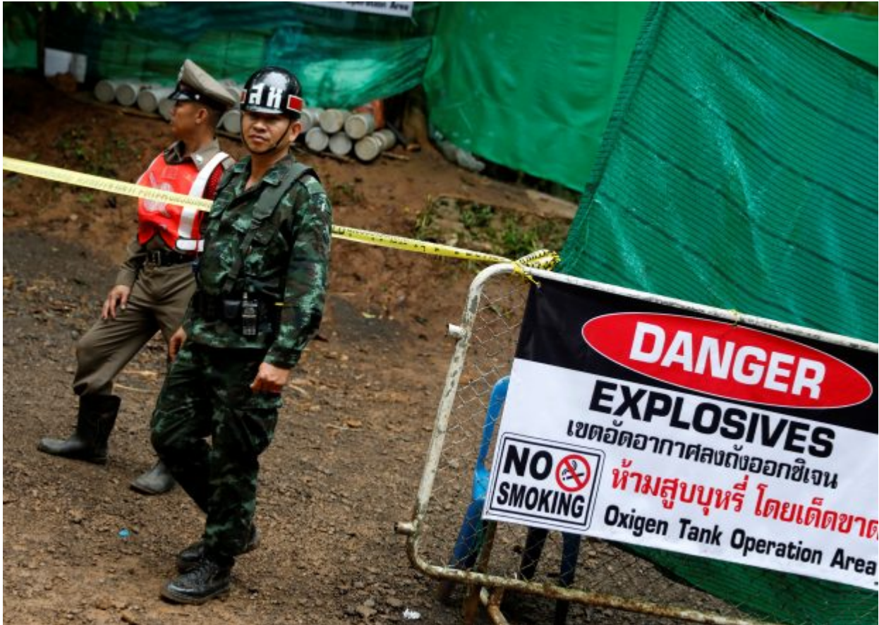
A police officer and soldier stand guard in front of Tham Luang cave complex, where 12 schoolboys and their soccer coach are trapped inside a flooded cave, after Thailand's government instructed members of the media to move out urgently, in the northern province of Chiang Rai, Thailand, July 8, 2018