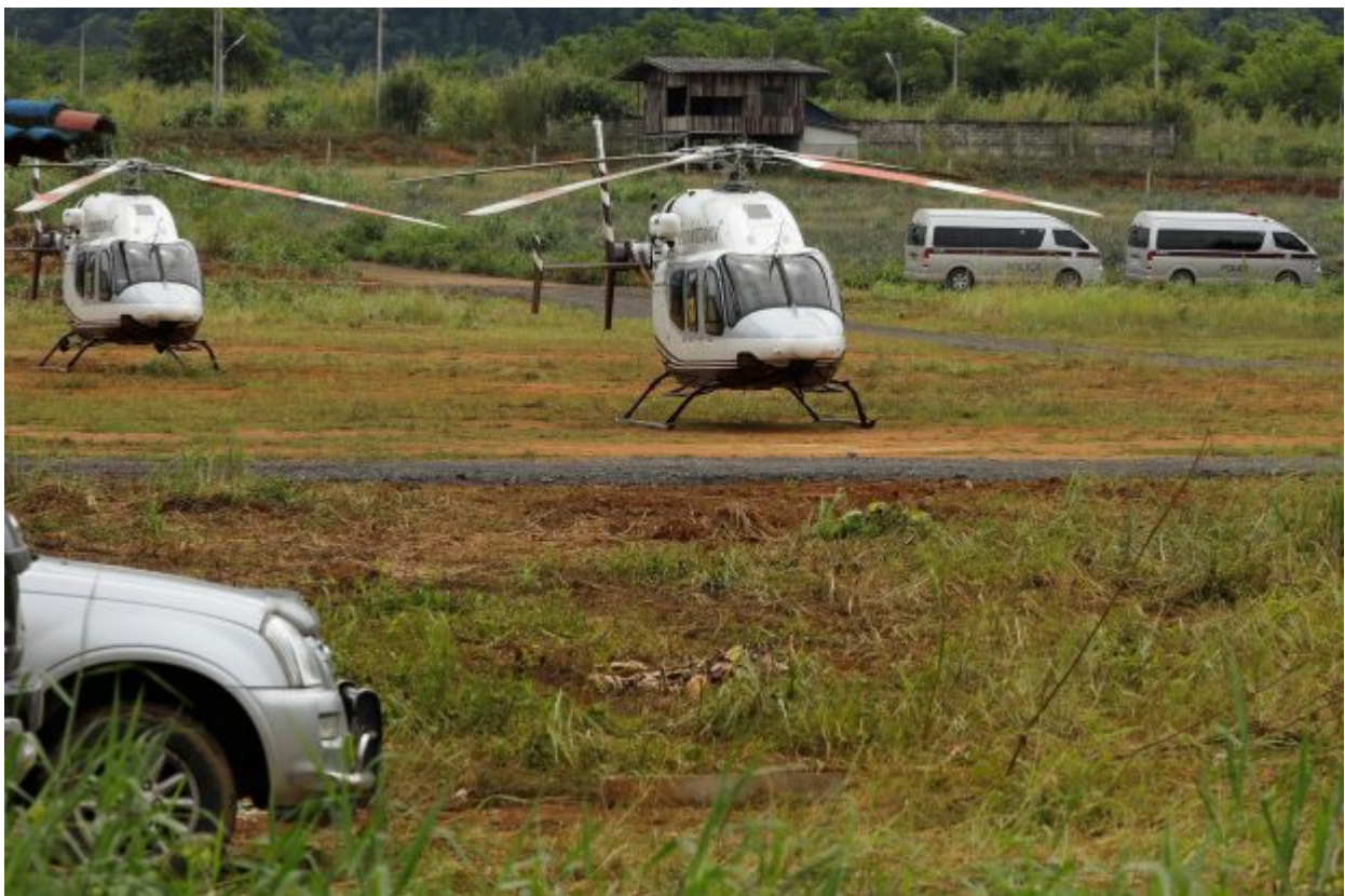
A general view shows helicopters expected to transport the schoolboys and their soccer coach who are