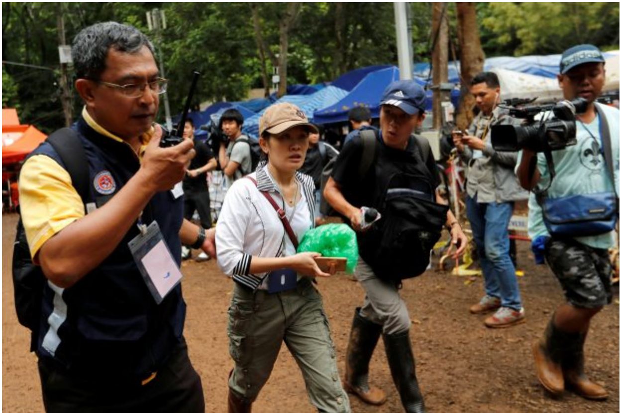
A family member walks outside the Tham Luang cave complex, where 12 schoolboys and their soccer coach are trapped inside a flooded cave, after Thailand's government instructed members of the media to move out urgently, in the northern province of Chiang Rai, Thailand, July 8, 2018.