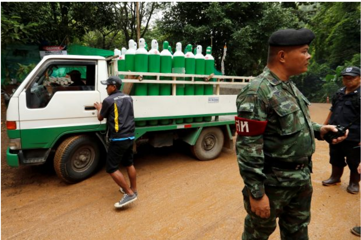
A truck carrying oxygen tanks arrives outside the Tham Luang cave complex, where 12 schoolboys and their soccer coach are trapped inside a flooded cave, in the northern province of Chiang Rai, Thailand,