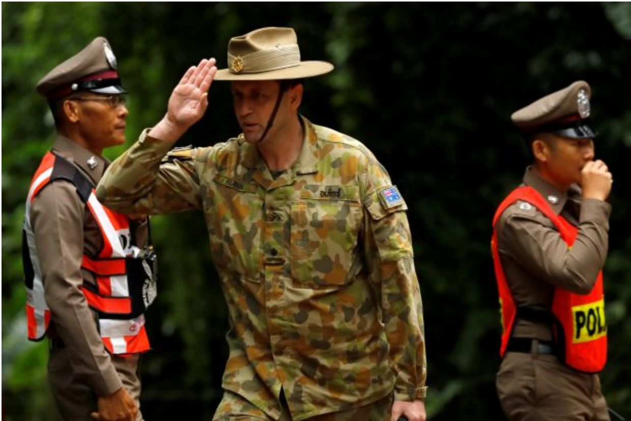
Australian military personnel gestures outside the Tham Luang cave complex, where 12 schoolboys and their soccer coach are trapped inside a flooded cave, in the northern province of Chiang Rai, Thailand, July 8, 2018.

complex, where 12 boys and their soccer coach are trapped, in the northern province of Chiang Rai, Thailand, in this screen grab of a video obtained on social media and taken July 7, 2018.