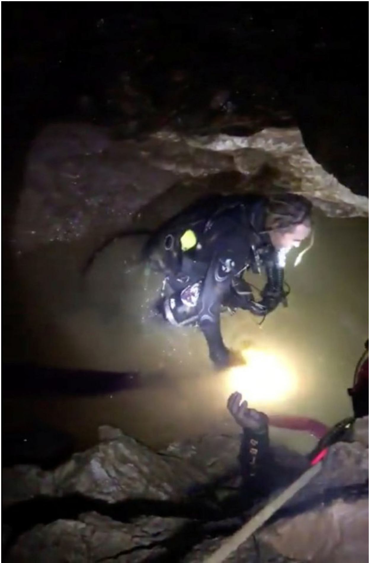
Ruamkatanyu Foundation rescuers are seen drillining ahead of the operation at the Tham Luang cave