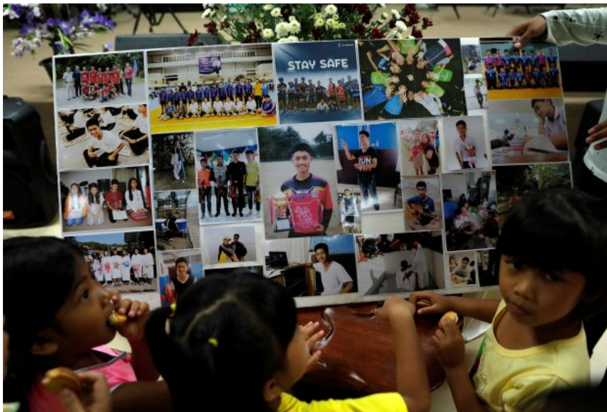
Children look at pictures before relatives and friends pray for the 12 schoolboys and their soccer coach trapped inside a flooded cave, at Mesai Grace Church in the northern province of Chiang Rai, Thailand, July 8, 2018. REUTERS/Soe Zeya Tun FOR EDITORIAL USE ONLY. NO RESALES. NO ARCHIVES.

«Όλοι όσοι δεν εμπλέκονται στην επιχείρηση πρέπει βγουν αμέσως από τη ζώνη», ανακοίνωσε από μεγάφωνα η αστυνομία στον χώρο γύρω από το σπήλαιο, όπου βρίσκονται εκατοντάδες δημοσιογράφοι. «Έχουμε όλο και περισσότερα μέσα ενημέρωσης που έρχονται και εγκαθίστανται παντού», είχε πει νωρίτερα ο επικεφαλής των επιχειρήσεων προσθέτοντας πως «οι ιατρικές ομάδες μου παραπονέθηκαν και αυτό γίνεται πρόβλημα».