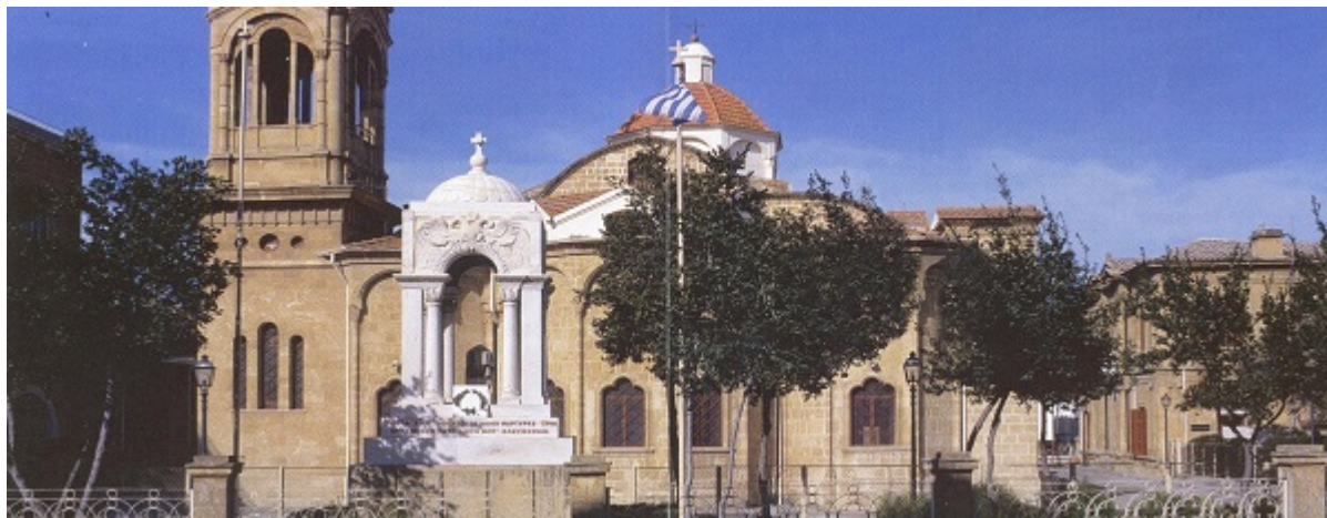
Ιερός Ναός Παναγίας Φανερωμένης Λευκωσίας.

Στις 30 Οκτωβρίου 1810 χειροτονήθηκε Αρχιεπίσκοπος Κύπρου. Ως Αρχιεπίσκοπος Κύπρου εργάστηκε με ζήλο, σύνεση και πατριωτισμό για τη βελτίωση τόσο της πνευματικής, όσο και της οικονομικής κατάστασης του ελληνικού πληθυσμού της νήσου. Μεριμνήσε για τη συνέχιση των εκδόσεων θρησκευτικών και μουσικών βιβλίων, για την αγιογράφιση ιερών Ναών και για τη διάδοση της ελληνικής παιδείας [7]. Χρηματοδότησε την ίδρυση της Ελληνικής Σχολής [8] (το σημερινό Παγκύπριο Γυμνάσιο) στη Λευκωσία απέναντι από την Ιερά Αρχιεπισκοπή. Το ενδιαφέρον του για το λαό το τεκμηριώνουν και οι διάφορες του ενέργειες. Κατά την περίοδο που έπληξε την Κύπρο η επιδημία της ακρίδος και απειλείτο η παραγωγή του νησιού, εξέδωσε εγκύκλιο καυτηριάζοντας τις δοξασίες που είχαν κάποιιοι λέγοντας ότι οι ακρίδες ήταν αθάνατες. Ταυτόχρονα παρακινούσε το ποίμνιό του να μην περιμένουν την εκ θαύματος εξολόθρευση του εντόμου αλλά το συντομότερο δυνατό να ελάμβαναν δράση [9]. Ακόμη, το 1815 απέστειλε επιστολή για καταδίκη του Ελευθεροτεκτονισμού [10]. Το έντονο ενδιαφέρον για την παιδεία φαίνεται και από το γεγονός ότι το 1820, ένα έτος πριν τον αδόκητο χαμό του, δώρησε 6000 γρόσια [11] για την ανέγερση σχολής στη Λεμεσό [12] [13].