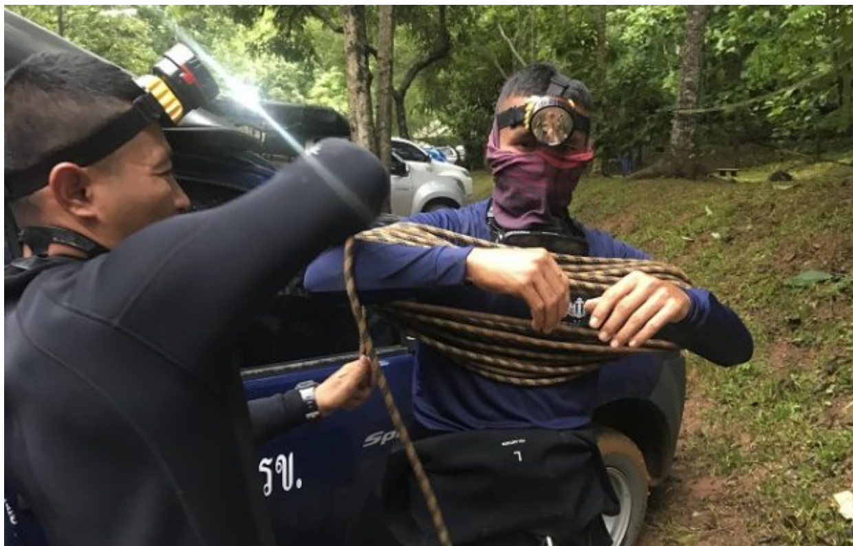
Rescue workers continue to search for a group of missing boys and their coach in a flooded cave, Tuesday, June 26, 2018, in Mae Sai, Chiang Rai province, northern Thailand. Electricians are extending a power line into a flooded cave in northern Thailand to help the search and rescue efforts for 12 boys and their soccer coach stranded three nights in the sprawling caverns and cut off by rising water.

«Δεν είμαστε βέβαιοι εάν μιλάμε για ένα θαύμα, ένα επιστημονικό επίτευγμα ή κάτι άλλο. Και οι 13 Wild Boars βγήκαν από το σπήλαιο» έγραψε η μονάδα SEAL του πολεμικού ναυτικού λεπτά μετά τη διάσωση.