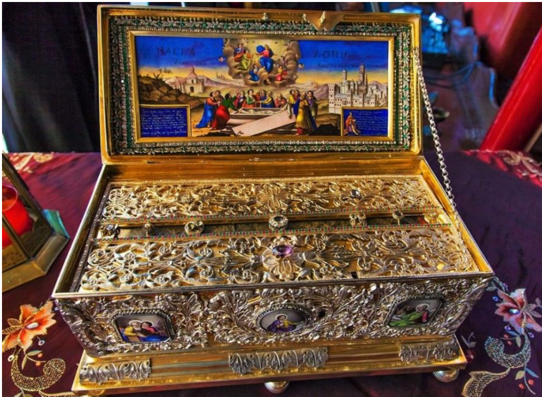
Sabuk Suci Sang Pemberi Kelahiran Allah Sang Sabda

Tali ini adalah Benda yang telah disucikan melalui Sabuk suci Sang Bunda Pelahir Allah Sang Sabda, dimana yang tetap dipelihara selama 14 abad. Tepatnya di monasteri