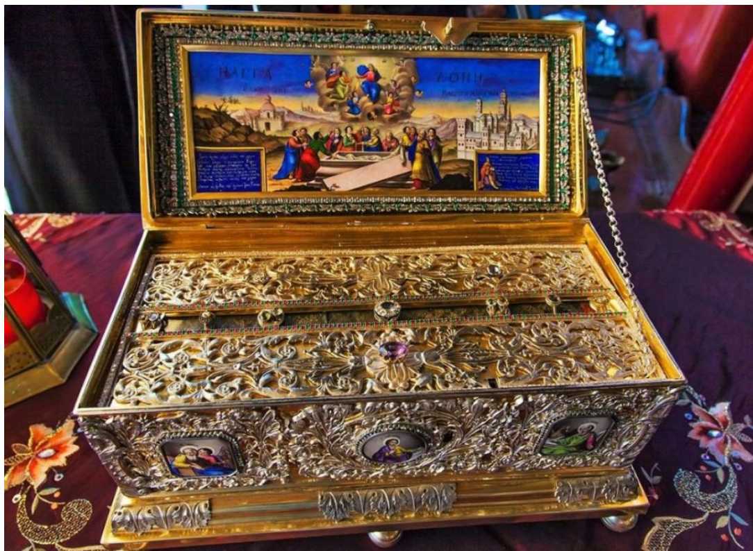
Brezi I Shenjtë I Shën Marisë (Nënës Të Jezu Krishtit)

Ky shirit është i bekuar mbi brezin e shenjtë të Shën Marisë. Brezi i shenjtë ruhet që nga shekulli i XIV (14) në monastirin e shenjtë të Vatopedhit si dhuratë e Perandorit Byzantin Ioanni Kantakouzinios. Ekziston një traditë e vjetër që vizitorëve besimëtarë të monastirit të Vatopedhit tu jepen si dhuratë shirita, të cilat janë bekuar mbi brezin e shenjtë edhe bëjnë shumë cudira. Me meshërimin e brezit të shenjtë të nënës të Krishtit zgjidhet në pëgjithësi shterpësia (stirosi) dhe shumë cifte që nuk lindin arrijnë të bëjnë fëmijë. Gjithashtu shërohen edhe sëmundjet kanceroze si edhe shumë sëmundje të rënda.