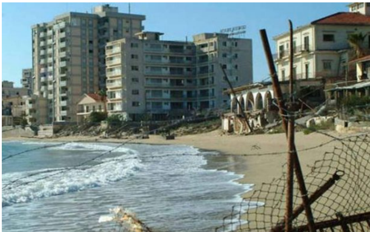
Η πόλη φάντασμα σήμερα

Η ομώνυμη συνοικία που βρίσκεται στην Έδεσσα, σύμφωνα με ιστορικά στοιχεία, είναι η πρώτη χριστιανική συνοικία που δημιουργήθηκε στην περιοχή, ως εξέλιξη του βυζαντινού οικισμού που αναπτύχθηκε στο χώρο της ακρόπολης και της αρχαίας πόλης.