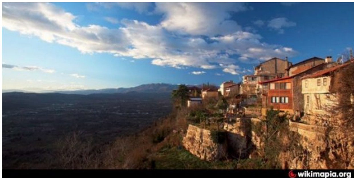
Η συνοικία όπως είναι σήμερα

Πρόσφατα έχει γίνει αποκατάσταση βαροσιώτικων σπιτιών η οποία στηρίχθηκε στην μελέτη ανάπλασης του Βαροσίου. Να σημειωθεί ότι η συγκεκριμένη μελέτη πήρε το 1ο βραβείο από την ΕΕ το 1990.