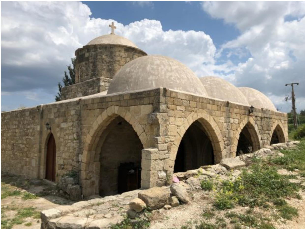
Η Αγία Αικατερίνη

Αρχιεπισκόπου Δαμασκηνού και του δραγομάνου Κορνέσιου (με την χαρακτηριστική πράσινη πόρτα όπως πολλές στο χωριό) ως επίσης και το δημοτικό σχολείο με μακραίωνη ιστορία που πλέον έχει μετατραπεί σε Κέντρο Περιβαλλοντικών Μελετών με περιοδικούς σπουδαστές από όλον τον κόσμο. Σε απόσταση περίπου 3 χλμ. από το χωριό σε ερημική τοποθεσία (περιοχή Φυτεύκεια) βρίσκεται κανείς και τη μεσαιωνική εκκλησία της Αγίας Αικατερίνης (τέλη 15ου - αρχές 16ου αι. μ.Χ.) κτίσμα με ιδιαίτερο αρχιτεκτονικό ενδιαφέρον αφού ανήκει στον τύπο της τρίκλιτης φραγκοβυζαντινής βασιλικής με τρούλο.