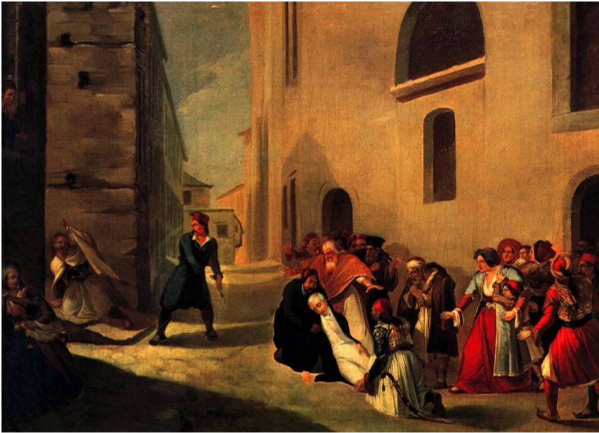
Διονυσίου Τσόκου: «Η δολοφονία του Ιωάννη Καποδίστρια» λάδι σε καμβά, 60 X 81 εκατ. Μουσείο Μπενάκη.

την Κυριακή στην εκκλησία. Τούτη την φορά όμως ο Κυβερνήτης ξεκίνησε πρωί πρωί για τον Γολγοθά του. Δεν τον σταμάτησε ούτε το σκυλάκι που είχε στην αυλή του που άρχισε ξαφνικά να του δαγκώνει το πόδι προσπαθώντας και αυτό με τον δικό του τρόπο να τον εμποδίσει να κατέβει την σκάλα του κυβερνείου.