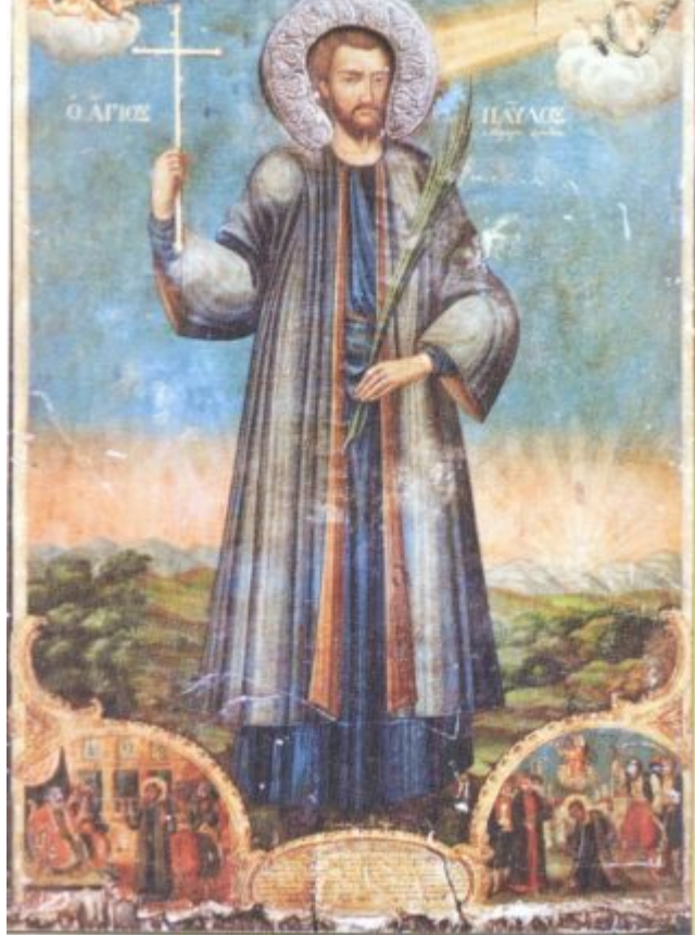
Αυτός ο ένδοξος του Χριστού Μάρτυρας

γεννήθηκε το 1790, καταγόταν από το χωριό Σοπωτό της επαρχίας Καλαβρύτων, το βαπτιστικό του όνομα ήταν Παναγιώτης κι ήταν γιός του Ιωάννη και της Αντώνας εκ του γένους των Πανουτσοπουλαίων. Πολλές φορές πήγαινε στην σημερινή γυναικεία Μονή των Αγίων Θεοδώρων που βρίσκεται πάνω από το Σοπωτό, παρακολουθούσε ακολουθίες, αγρυπνίες κι αναλογιζόταν το μαρτύριο των Αγίων της Μονής, ευχόμενος να αξιωθεί κι αυτός ενός τέτοιου μαρτυρίου. Στην διαμόρφωση του ορθόδοξου χαρακτήρα του συνέβαλε ο αείμνηστος Επίσκοπος Ανδρούσης Κωνστάντιος, ο οποίος καταγόταν από το Σοπωτό και μαζί με τον Παλαιών Πατρών Γερμανό πρωταγωνίστησε στην κήρυξη της Ελληνικής Επανάστασεως στην Ιερά και Ιστορική Μονή της Αγίας Λαύρας Καλαβρύτων[3]. Ο Παναγιώτης σε μικρή ηλικία πήγε στην Πάτρα όπου έμαθε την τέχνη του σανδαλοποιού κι αφού εργάστηκε εκεί για δεκατέσσερα χρόνια αναχώρησε για τα Καλάβρυτα, νοίκιασε εργαστήριο κι εξάσκησε την τέχνη του. Ο διάβολος όμως γρήγορα μίσησε την ενάρετη βιωτή του κι όχι απλά τον πείραξε αλλά τον έκανε να αρνηθεί την πίστη του με τον εξής τρόπο. Οι ιδιοκτήτες του εργαστηρίου ζητούσαν από τον Παναγιώτη περισσότερα χρήματα από τα συμφωνημένα κι αφού δεν είχε να τα δώσει φυλακίστηκε. Πιεζόμενος έπειτα να τα δώσει σε κατάσταση θυμού είπε «Τούρκος να γίνω, εάν δώσω περισσότερα», όμως τα έδωσε και τότε αποφυλακίστηκε κι άρχισε με δύο φίλους του να διασκεδάζει στην περιοχή της Τριπόλεως διαλαλώντας πως είχε Τουρκέψει[4]. Ο Παναγιώτης την περίοδο εκείνη