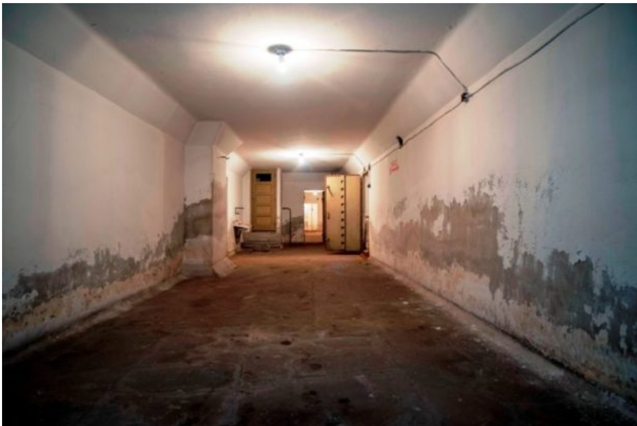
Μεγάλο καταφύγιο στο λιμάνι του Πειραιά

Θα σας αναφέρω κάτι για πρώτη φορά. Πριν μερικούς μήνες έτυχε να επισκεφθούμε ένα καταφύγιο σε εργοστάσιο στον Πειραιά. Αφού πήραμε την άδεια, μας είπε ο ιδιοκτήτης του εργοστασίου ότι ο χώρος ήταν πλημμυρισμένος για πολλές δεκαετίες και ότι δεν έχει μπει κανείς μέσα, ποτέ. Έβαλε μια αντλία, άντλησε τα ύδατα και κατεβήκαμε κάτω. Στο τέλος του καταφυγίου βρήκαμε μια δεύτερη είσοδο/έξοδο. Ήταν η έξοδος κινδύνου, η οποία ήταν κλεισμένη από πάνω, με μια βαριά λαμαρίνα. Βγήκαμε, ρωτήσαμε τον ιδιοκτήτη του εργοστασίου πού είναι η δεύτερη έξοδος (να τη δούμε και απέξω) και δεν είχε ιδέα καν, ότι υπήρχε δεύτερη έξοδος! Ψάχνοντας μέσα στο εργοστάσιο -μαζί με τους ανθρώπους της εγκατάστασης- βρήκαμε μια τεράστια σιδερένια πλάκα σε ένα εργαστήριο. Φέραμε μια ολόκληρη γερανογέφυρα, σηκώσαμε τη σιδερένια πλάκα και αποκαλύφθηκε η χαμένη έξοδος! Ένας εργάτης -με έκδηλη την απορία στο πρόσωπό του- μας είπε ότι εργάζεται στο εργοστάσιο από το 1978 και δεν θα πίστευε ποτέ ότι επί 40 χρόνια πατούσε πάνω από ένα καταφύγιο χωρίς να το έχει πάρει χαμπάρι.