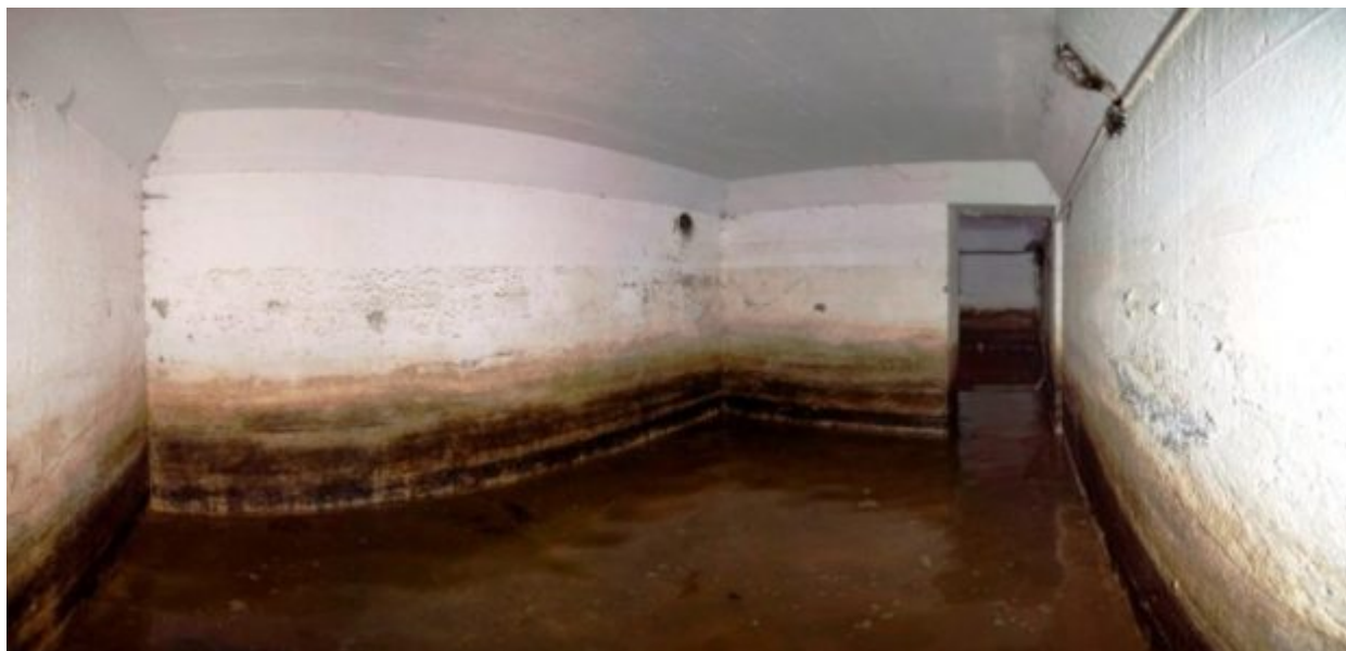
Θάλαμος καταφυγίου γεμάτος νερό