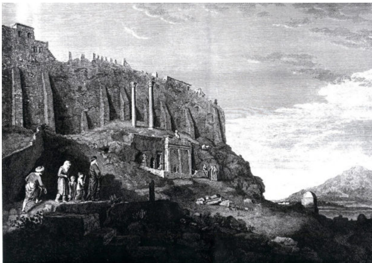
Η μορφή του Θρασυλλείου στα μέσα, περίπου, του 18ου αι., από τους Βρετανούς καλλιτέχνες James Stuart και Nicolas Revett

Δημιουργήθηκε περί το 320 π.Χ. από τον Θράσυλλο, αγωνοθέτη των Μεγάλων Διονυσίων και έφερε μορφή ναΐσκου στο πρότυπο των χορηγικών μνημείων. Το μνημείο κατέρρευσε ύστερα από κανονιοβολισμό το 1827, κατά τη διάρκεια της πολιορκίας της Ακρόπολης από τους Τούρκους. Τα σιδερένια κάγκελα σήμερα δηλώνουν με τον τρόπο τους, ότι κάτι πολύτιμο κρύβει στο εσωτερικό του.