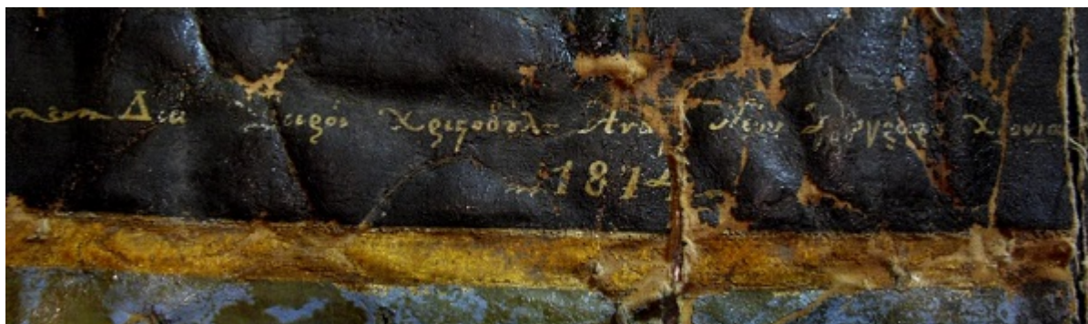
Εικόνα 2. Λεπτομέρεια της επιγραφής.

στα πέρατα της επικράτειας της Οθωμανικής Αυτοκρατορίας. Μάλιστα όπως φαίνεται, με το πέρασμα των ετών οι τεχνίτες του κάθε χωριού ανέπτυξαν την εξειδίκευσή τους και διαμόρφωσαν μαστορικές σχολές και τεχνοτροπίες. Το χωριό Χιονιάδες τοποθετείται 17 χλμ. ΒΔ της Μόλιστας, σε υψόμετρο 1150 μ. στις νότιες πλαγιές του ορεινού συμπλέγματος του Γράμμου και κατά τους χειμερινούς μήνες δεν διαθέτει κανένα κάτοικο.