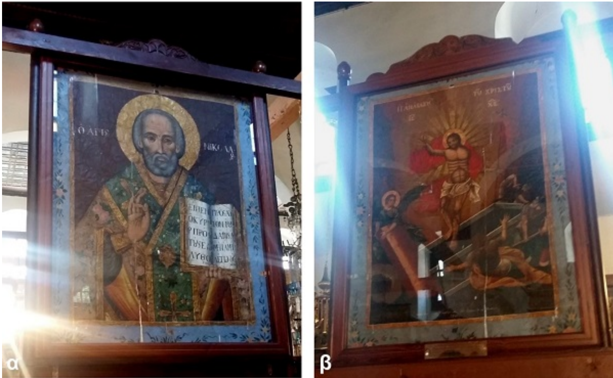
Εικόνα 6. Άποψη, από το εσωτερικό του ναού, με το λάβαρο στην τελική του θέση εντός της προθήκης.

τοποθέτηση του διασωθέντος εκκλησιαστικού κειμηλίου σε κατάλληλη θέση εντός του Ιερού Ναού ολοκλήρωσε την αποκατάστασή του στην συλλογή των κειμηλίων αυτού (Εικόνα 6).