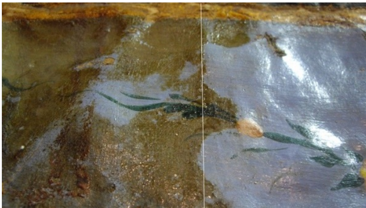
Εικόνα 4. Κατά την διάρκεια του χημικού καθαρισμού της ζωγραφικής επιφάνειας.