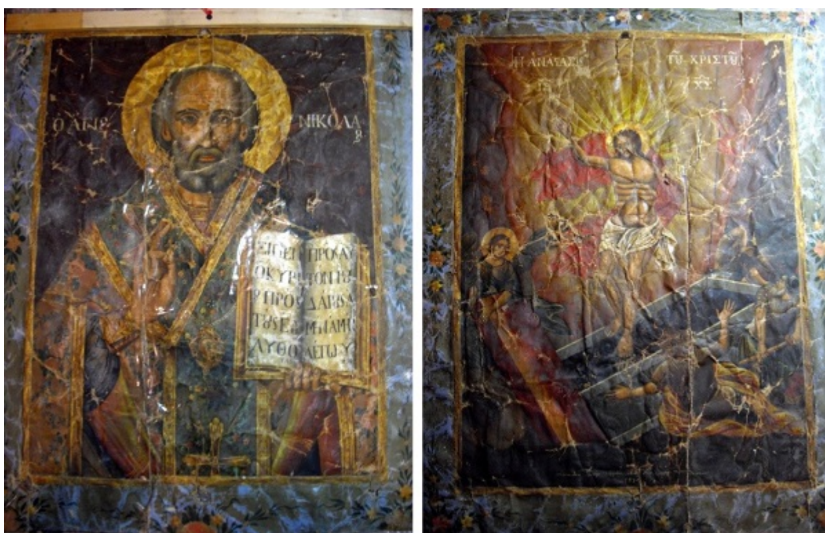
Εικόνες 1. Η αρχική κατάσταση της διατήρησης του αμφίπλευρου λάβαρου πριν τις εργασίες συντήρησης.

Κόνιτσας της Περιφερειακής Ενότητας Ηπείρου και αριθμεί 23 μόνιμους κατοίκους βάση της τελευταίας απογραφής του 2011. Ο οικισμός της Μόλιστας αναπτύσσεται στις δυτικές παρυφές του όρους Σμόλικας, εντός πυκνούς δασώδους έκτασης, και αμφιθεατρικά, εντός μικρής γεωμορφολογικής λεκάνης με άφθονη παρουσία φυσικών πηγών νερού. Γειτνιάζει με τα χωριά Γαναδιό και Μοναστήρι από κοινού με τα οποία αποτελεί γνήσιο δείγμα της παραδοσιακής αρχιτεκτονικής και λαϊκής τέχνης που χαρακτηρίζει την Κονιτσιώτικη παράδοση (Γκουτος 2003). Ο Ιερός Ναός του Αγίου Νικολάου βρίσκεται στο κέντρο του χωριού, ένα επίπεδο επάνω από την κεντρική πλατεία. Αποτελεί ξυλόστεγη τρίκλιτη βασιλική με έτος κτήσεως το 1878 (κτητορική πλάκα), και φέρει περίτεχνο ξυλόγλυπτο τέμπλο φιλοτεχνημένο από Μετσοβίτες τεχνίτες (Κούσιος 1971, Γκούτος 2003).