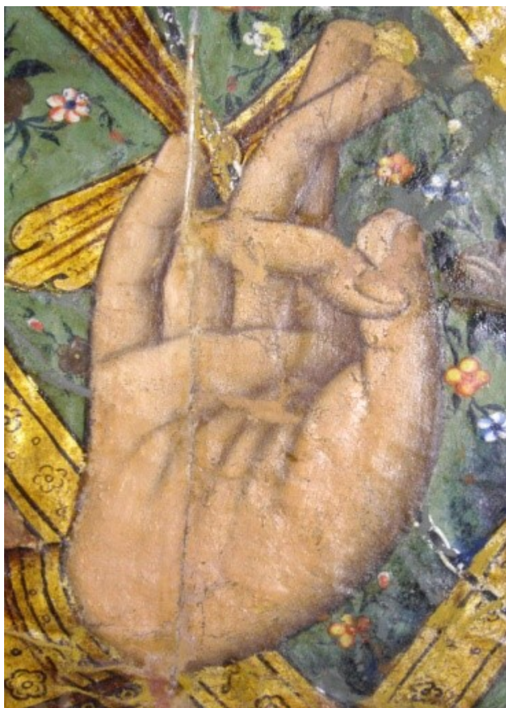
Εικόνα 5. Ένωση σχισμής με θερμοπλαστική ταινία.

Τα αρχικά στάδια της συντήρησης του έργου περιελάμβαναν την φωτογραφική τεκμηρίωση, την σχεδιαστική αποτύπωση και τον προκαταρκτικό επιφανειακό καθαρισμό της ζωγραφικής επιφάνειας για την απομάκρυνση των ατμοσφαιρικών ρύπων. Ακολούθησε η ολική επιπεδοποίηση του υποστρώματος και η στερέωση της ζωγραφικής επιφάνειας. Τις εργασίες αυτές διαδέχθηκαν σημειακές δοκιμές (spot test) διαλυτότητας και ακολούθησε η αφαίρεση των λιπαρών επικαθήσεων με μηχανικό καθαρισμό και η αφαίρεση του στρώματος του οξειδωμένου βερνικιού με χημικό καθαρισμό (Εικόνα 4). Στην συνέχεια έγινε η στερέωση και η ένωση των σχισμών (Εικόνα 5).