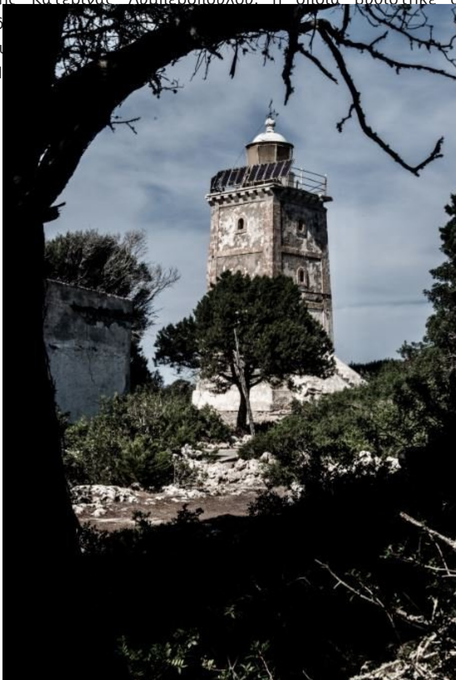
Ο ιστορικός φάρος των