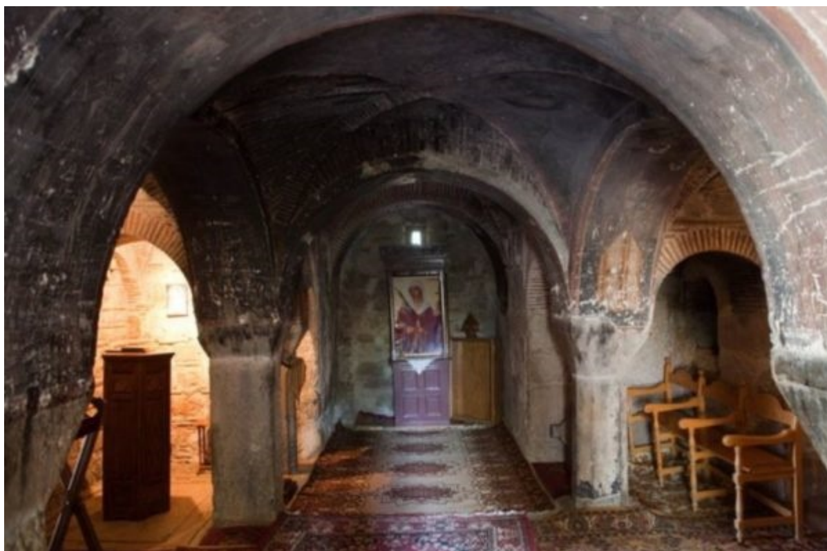
Η Κρύπτη του Αγίου Νικολάου.

Η Κρύπτη της Αγίας Βαρβάρας στεγάζει εντός της τον τάφο του ιδρυτή της Μονής, του Οσίου Λουκά, αφού στο χώρο αυτό ήταν το κελί του, όπου και ετάφη. Ενόσω ακόμη ο Όσιος Λουκάς ζούσε, άρχισε να κτίζει την Εκκλησία της Αγίας Βαρβάρας (σήμερα είναι αφιερωμένη στην Παναγία), την οποία τελείωσαν οι συμμαναστές του Οσίου δύο χρόνια μετά το θάνατό του. Δεν γνωρίζουμε πότε η Εκκλησία της Αγίας Βαρβάρας αφιερώθηκε στην Παναγία και αντίστοιχα η Κρύπτη στην Αγία Βαρβάρα. Πάντως ο Όσιος Λουκάς τιμούσε και ευλαβούνταν την μεγαλομάρτυρα Αγία Βαρβάρα.