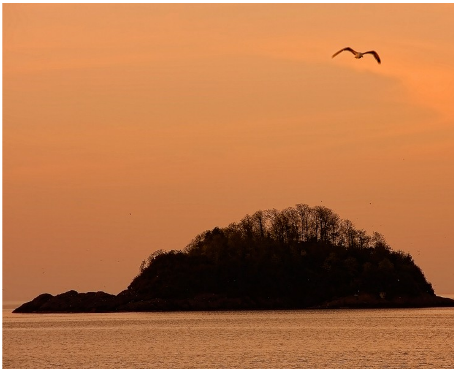
Μαυροθαλασσοπούλι σε... χαμηλή πτήση σκίζει το μούχρωμα της Ανατολής, πάνω από το Νησί.