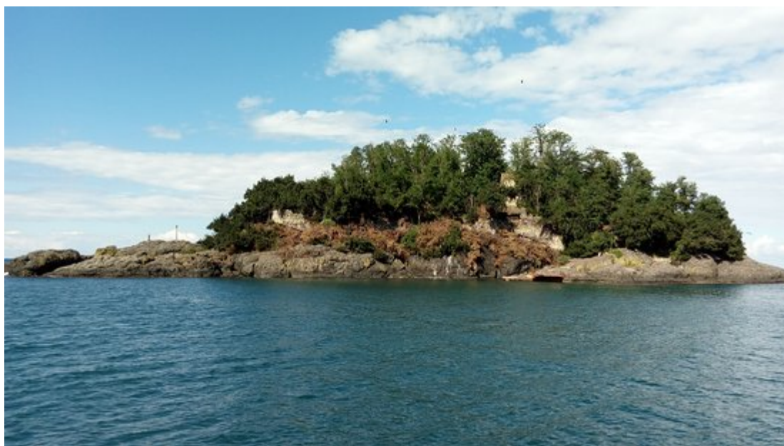
Για 2.000 χρόνια η Αρητιάδα αποτέλεσε θρησκευτικό - λατρευτικό κέντρο, προκεχωρημένο φυλάκιο και ενάλιο παρατηρητήριο («φрукτωρία») της Κερασούντας.