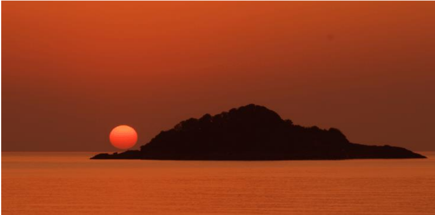
Η «άσβεστη κανδήλα» της Αρητιάδας με φόντο ένα «ματωμένο» Ποντιακό ηλιοβασίλεμα

Κερασούντα η οποία αριθμεί πλέον περίπου 75.000 κατοίκους.