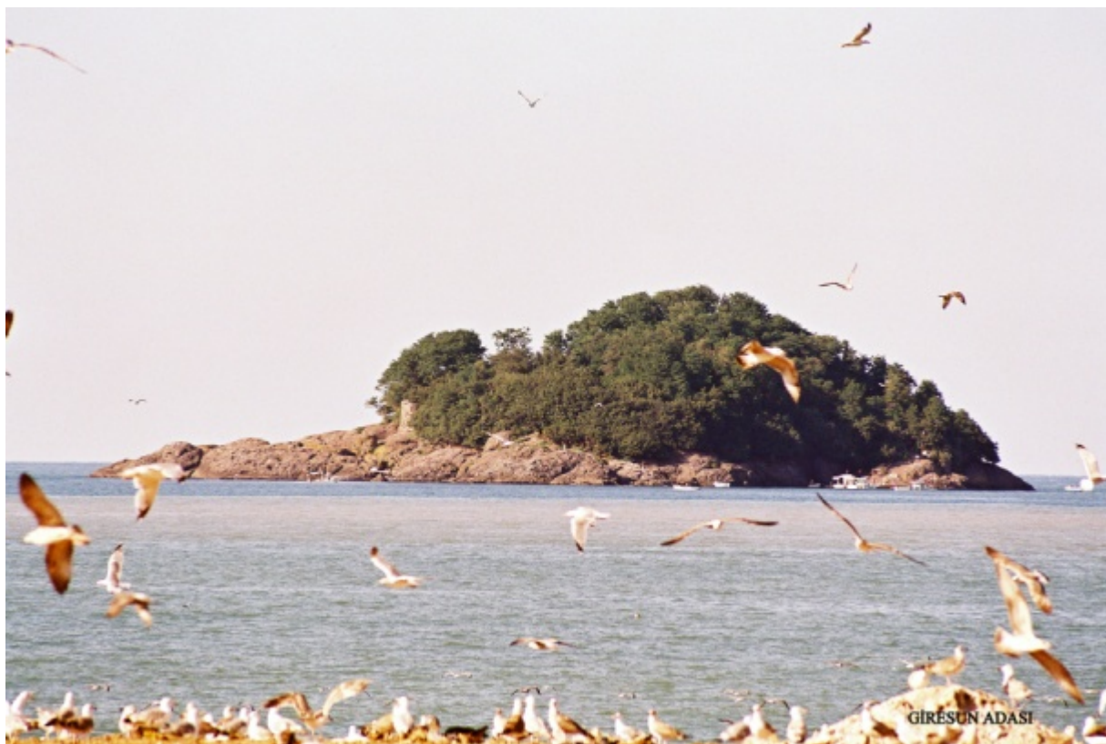
Σύμφωνα με τη μυθολογική παράδοση, αφού ο Ηρακλής εξεδίωξε τις Στυμφαλίδες Όρνιθες από την Πελοπόννησο, αυτές βρήκαν καταφύγιο στο νησί τους Άρεως στον Εύξεινο Πόντο.

ανασκαφικό έργο των αρχαιολόγων (το οποίο αναμένουμε εναγωνίως!). Έτσι, δεν είναι ακόμα δυνατός ο ακριβής εντοπισμός του αρχαιοελληνικού υπαίθριου ιερού (ή ιερών) όπου θυσίαζαν οι Αμαζόνες και οι Αργοναύτες σύμφωνα με τη Μυθιστορία. Μεταξύ των σαφών ενδείξεων περί ύπαρξης τέτοιων λατρευτικών χώρων στο Νησί, είναι και μια μεγάλη μαύρη πέτρα που βρίσκεται στην ανατολική βραχώδη ακτή. Σημειώνεται ότι η εν λόγω πέτρα ονομάζεται από τους ντόπιους "Hamza Stone" και έχει συνδεθεί με ένα έθιμο το οποίο έχει δυσανάγνωστη προέλευση. Κάθε χρόνο στις 7 (yedi) Μαΐου (20/05 με το Γρηγοριανό Ημερολόγιο), πολλοί επισκέπτες έρχονται στο Giresun Adasi για να βαδίσουν τρεις φορές γύρω από αυτό το βράχο, ψιθυρίζοντας ευχές. Γενικότερα όμως, αυτές τις μέρες του έτους διεξάγεται στην Κερασούντα μια πολυσυλλεκτική γιορτή με θέμα τις άυλες πολιτιστικές κληρονομίες της ευρύτερης περιοχής: το International Aksou Festival. Πολλοί συμμετέχοντες φέρνουν ο καθένας από επτά ζευγάρια βότσαλα, προερχόμενα από την ηπειρωτική ενδοχώρα. Στέκουν στις εκβολές του ποταμού Ασκιανού -με πλάτη προς την Αρητιάδα- και πετούν τα βότσαλα στη θάλασσα. Σε τέτοιες περιπτώσεις δοξασιών, πέρα και πάνω από γεωγραφικά σύνορα, τα συνήθη «διακυβεύματα» είναι η υγεία, η γονιμότητα, η καλή τύχη, η εξάλειψη του φόβου του Θανάτου... Ποικίλα ήθη κι έθιμα των οποίων οι ρίζες χάνονται στα βάθη του χρόνου, του χώρου και των τοπικών δεισιδαιμονιών.