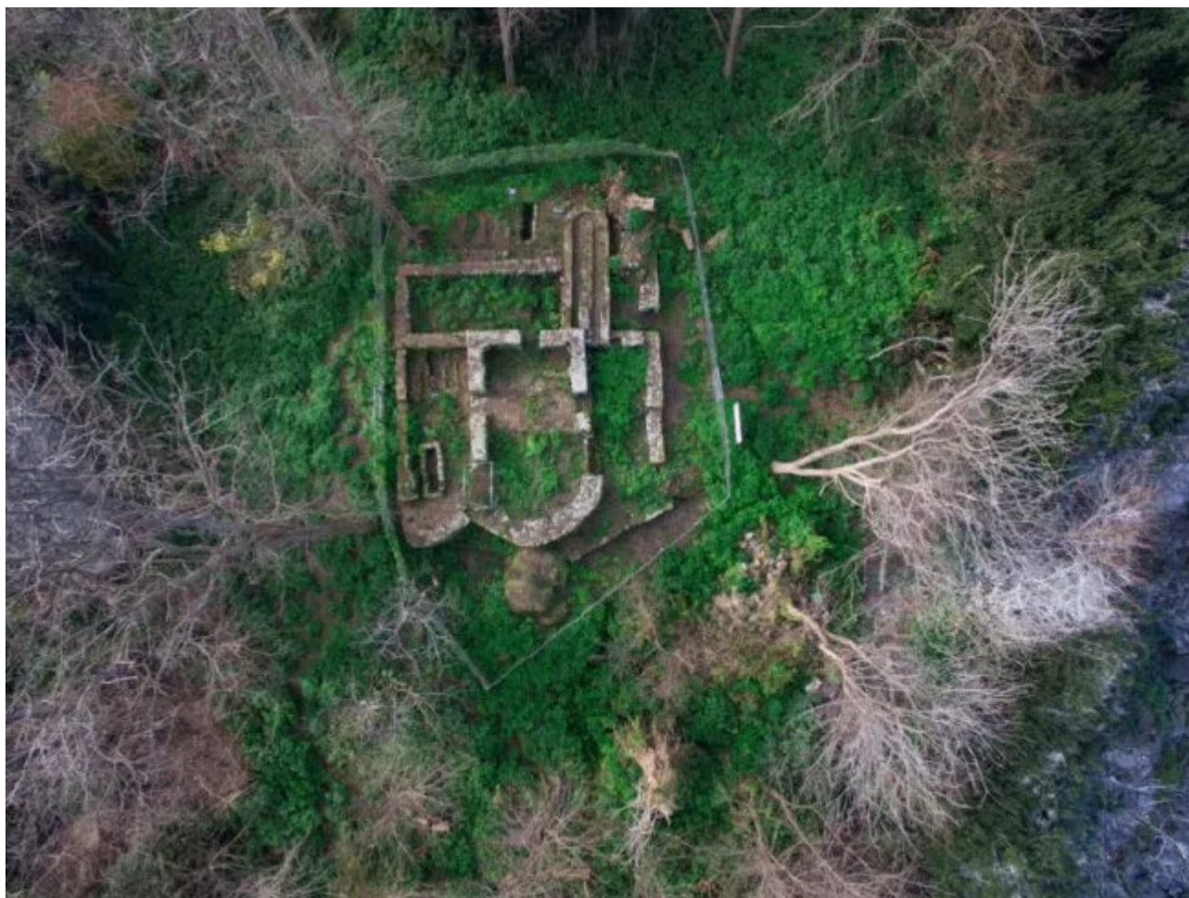
Φωτογραφία από αέρος, όπου φαίνεται η χαρακτηριστική «κάτοψη» από την εκκλησία του Αγίου Φωκά

3 χλμ από την προκυμαία της σύγχρονης πόλης Giresun (πλησίον της αρχαίας Φαρνακίας - Pharnakeia). Γενικότερα, υπογραμμίζεται ότι στα εκτεταμένα βόρεια μικρασιατικά παράλια οι κόλποι και οι φυσικοί λιμένες σπανίζουν ενώ ο αριθμός νήσων είναι εξαιρετικά περιορισμένος. Χηλή, Δάφνη, Sary Ada, Κιλικόνησος, Φιλυρηίς, Fugun Adasi είναι (πέραν της Αρητιάδας) τα ονόματα των πιο βασικών νησίδων της περιοχής που, παρά το μικρό μέγεθός τους, σχετίζονται άμεσα με κάποιες πτυχές της ιστορίας του Ελληνισμού.