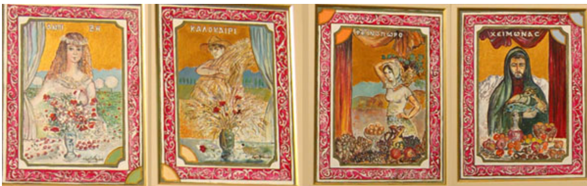
Λαογραφικό Μουσείο Κοζάνης

...Και μια ζεστή αγκαλιά περίμενε και τη Δήμητρα και τον Μανόλη.