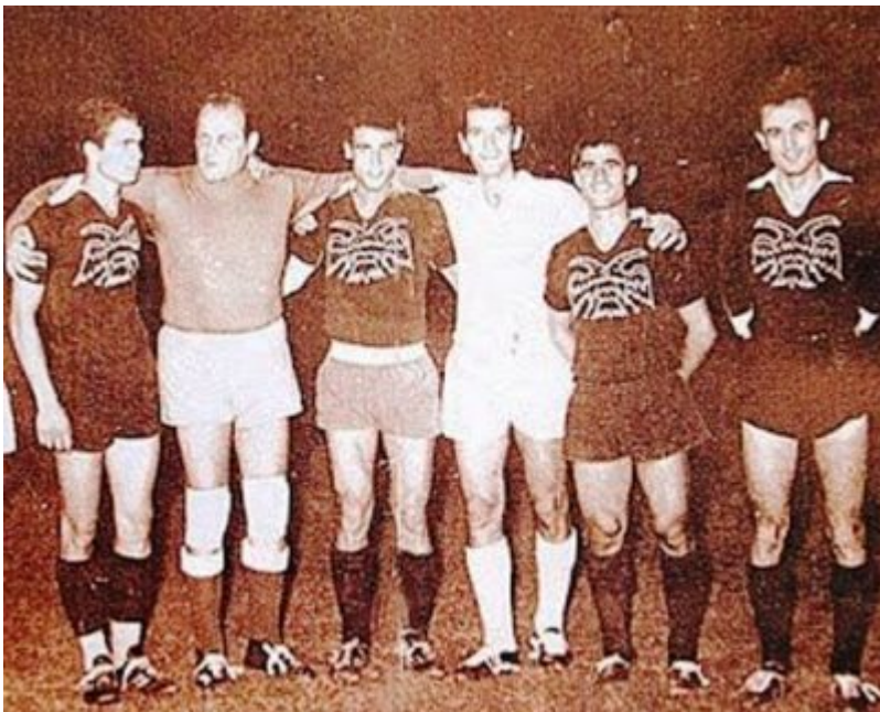
Φωτογραφία από τον φιλικό αγώνα στη Θεσσαλονίκη. Ο Κούρκουλος και ο Κωνσταντάρας αγκαλιά με τους παίκτες του ΠΑΟΚ.

Όμως, δεν ήταν η πρώτη φορά που το κοινό είδε τους ηθοποιούς του ελληνικού κινηματογράφου με ποδοσφαιρική φανέλα. Σε νεαρή ηλικία για ένα σύντομο χρονικό διάστημα ο Λάμπρος Κωνσταντάρας ήταν τερματοφύλακας στην ομάδα της ΑΕΚ. Συνήθως, αναπληρωματικός. Ο Νίκος Κούρκουλος από μικρός λάτρευε τον αθλητισμό και πάνω από όλα το ποδόσφαιρο. Οι προπονητές του έλεγαν ότι ήταν αυθεντικό ταλέντο. Για ένα διάστημα έπαιζε στον Παναθηναϊκό ως επιθετικός. Παράλληλα, ο Κούρκουλος είχε ξεκινήσει μαθήματα υποκριτικής στη δραματική σχολή του Εθνικού Θεάτρου. Το ποδόσφαιρο έπρεπε να μείνει πίσω.