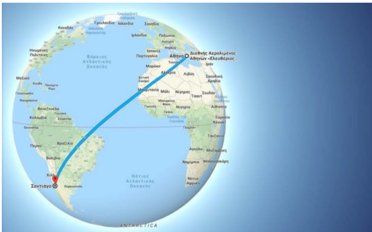
Η απόσταση της Αθήνας από το Σαντιάγο υπολογίζεται σε 12.546 χλμ

Στη Χιλή, πέραν της πρεσβείας, που είτε συνδιοργανώνει είτε θέτει υπό την αιγίδα της πολιτιστικές εκδηλώσεις υπάρχουν πολλοί και σημαντικοί φορείς που δραστηριοποιούνται στον τομέα αυτό, όπως αναφέρει το ελληνικό υπουργείο Εξωτερικών. Ανάμεσα σε αυτούς είναι το Κέντρο Κλασικών Σπουδών του Πανεπιστημίου Metropolitana του Σαντιάγο, το Ελληνο-χιλιανό Εμπορικό και Πολιτιστικό Επιμελητήριο, το Ίδρυμα Γαβριήλ και Μαρίας Μουστάκη, ο Σύλλογος Φίλων Ν. Καζαντζάκη και άλλα.