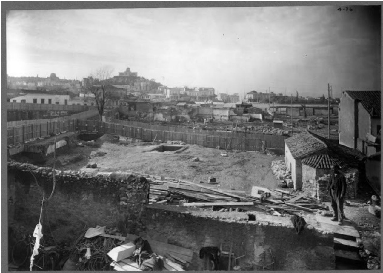
Κατατοπιστική φωτογραφία από την περιοχή της Νοτιοδυτικής Κρήνης (Μάρτιος 1934). Δεξιά φαίνεται το δίδυμο εκκλησάκι ενώ στο βάθος (δυτικά) ξεπροβάλλει ο λόφος του Αστεροσκοπείου.

«Ὡς στύλος ἀκλόνητος, τῆς Ἐκκλησίας Χριστοῦ, καί λύχνος αἰφώτος τῆς οἰκουμένης σοφέ, ἐδείχθης Χαράλαμπες...».