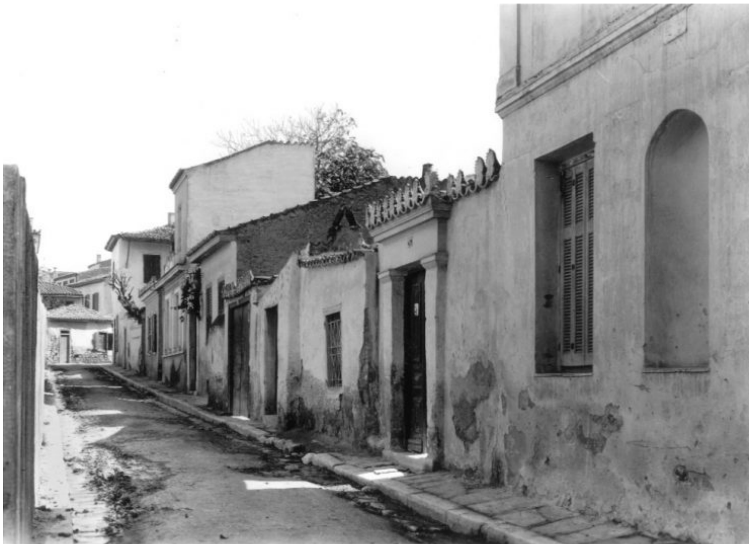
Σπίτια από τη γειτονιά του Ηλία και Χαραλάμης... «θλιβερό συναπάντημα, η μια λιτανεία έσμιγε με την άλλη, περισσότερες στις φτωχές συνοικίες της παλαιάς πόλεως, στον Άγιο Φίλιππο, στη Βλασαρού, στους Αγίους Αποστόλους, στους Αέρηδες, στις συνοικίες της Πλάκας...» («Η Ξένη του 1854», Εμμ. Λυκούδης).

Παράλληλα, ο Καμπούρογλου γράφει για μια σύγχυση (συσχέτιση - ταύτιση;) της εποχής, μεταξύ των ονομάτων Ηλίας και Χαραλάμης «όστις απλώς ως Λάμης ήτο γνωστός εις τους φέροντας το όνομα τούτο εν Αθήναις συνδυάσαντες ούτω την λάμπιν προς τον Ήλιον» (Ηλία;)!