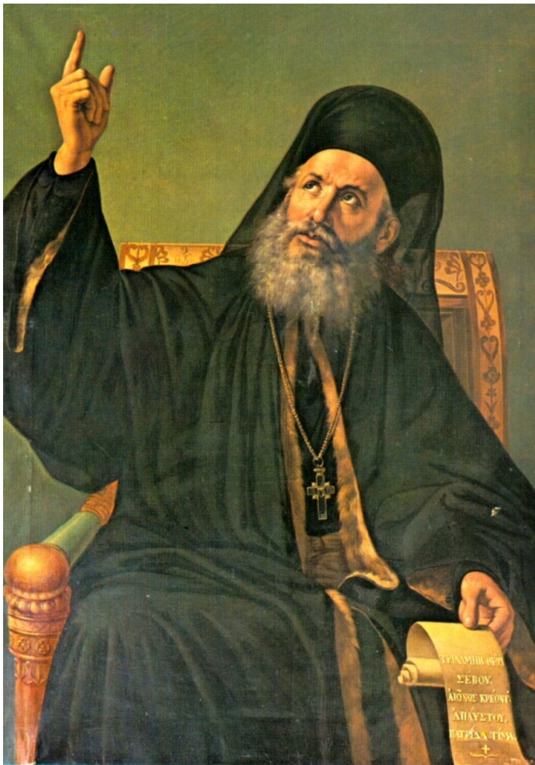
Άγιος Γρηγόριος ο Ε΄

από τον Κωνσταντίνο Οικονόμου εξ Οικονόμων