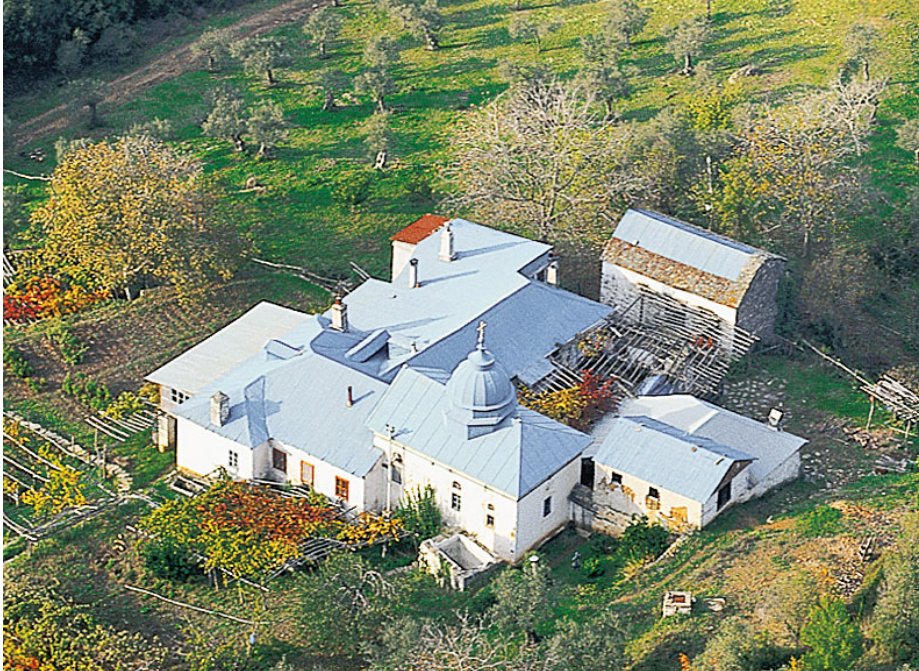
Το βατοπαιδινό κελλί του Αγίου Υπατίου, που βρίσκεται σε απόσταση 15 λεπτών διαδρομής από τη Μονή.

Ο Υπάτιος ήταν μορφή από εκείνες πού δόξασαν την Εκκλησία στους πρώτους αιώνες της και αγωνίσθηκαν για το θρίαμβο, του χριστιανισμού και της Ορθοδοξίας. Ήταν επίσκοπος Γαγγρών (σημερινό Τσάγγρι) επισκοπής της Παφλαγονίας στα χρόνια του Μεγ. Κων/νου και συμμετείχε στην Α' Οικουμενική Σύνοδο στη Νίκαια, κατά της πλάνης του Αρείου. Ανήγειρε ναούς, πτωχοκομεία και άλλα φιλανθρωπικά ιδρύματα. Στις ποιμαντικές περιοδείες του συνοδευόταν από δύο μοναχούς και χρησιμοποιούσε ένα γαϊδουράκι μιμούμενος τον Χριστό. Ζούσε