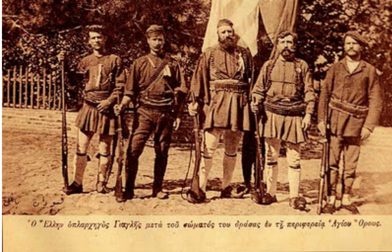
'Ο Έλλησ όπλαρχηγός Γιαγκλής μετά τοσ σώματός του θράσας έν τῃ περιφεραία 'Αγίου Όρους.

«Λήσταρχος», σύμφωνα με την Διεύθυνση Ιστορίας του Γενικού Επιτελείου Στρατού, ο Γιαγκλής επιστρατεύτηκε από τον σύλλογο των Αθηνών «Μέγας Αλέξανδρος», «ενήργει αυτοβούλως και διέσπα τον αγώνα με τας αλλοπροσάλλους ενεργείας του και τας ακρότητάς του».