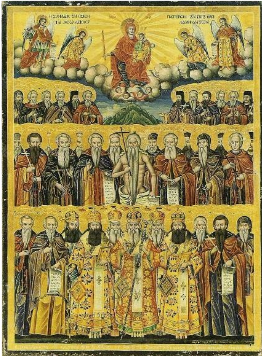
Η Σύναξη των Αγιορειτων Πατέρων Φορητή εικόνα Ιεράς Κοινότητας Αγίου Όρους (1849)

/ Άγιοι - Πατέρες - Γέροντες / Άγιον Όρος / Ορθόδοξη πίστη / Συναξαριακές Μορφές